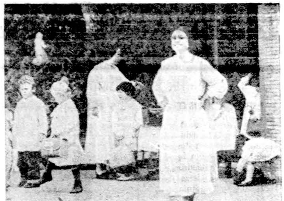
Italijoje katalikų parapijos ir organizacijos išlaiko 22.000 švietimo bei auklėjimo įstaigų, mokyklų, iš jų 21.000 vaikų darželių. Romoje kiekvienas ketvirtas vaikas eina į katalikišką mokyklą. Dabar komunistai žaro spaudimą iš katalikų mirties įstaigas atimti. Atvaizde — seselės vienoje katalikiškoje mokykloje.

Kokiomis kortomis žaidė Carteris? Stebint jo eįmų kiekviena