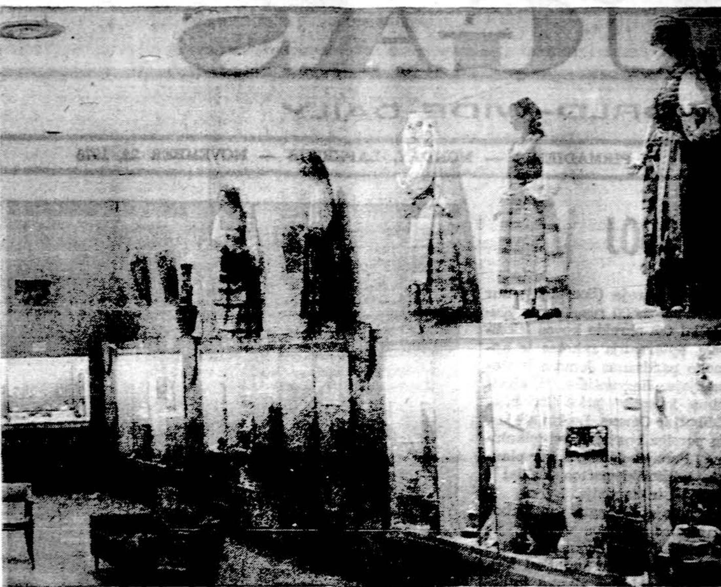
Lietuvių Bicentennial komiteto suruoštos parodos Detroito Tarptautinio Instituto tautybių salės vienas kampas.

E. Tamošaitienė kilusi iš Klaipėdos krašto. Gimnaziją ėjo Šilutėje. Mokėsi Tauragės mokytojų seminarijoje, lankė Klaipėdos muzikos mokyklą, vėliau vaidino ir dainavo Kauno teatre. Čia buvo gera kūno kultūros ir tautinių šokių mokytoja. Jos vadovaujama šokėjų grupė buvo pasiekusi tarptautinių laimėjimų. Ji ruošė gražius vaidinimus.