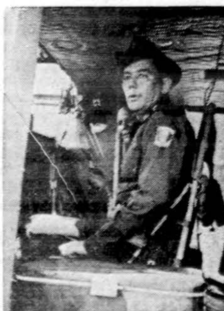
Panamos diktatorius Torrijos, griežtai reikalaujantis Amerikos pasitraukimo iš kanalo

„Chicago Daily News“ rašo, jog Prancūzijoje pradama baimintis, kad vokiečiai labai slaptai galėtų pasigaminti atominių bombų Brazilijoje. Taikos sutarty po II pasaulinio karo Vakarų Vokietijai atominių ginklų turėti uždrausta.