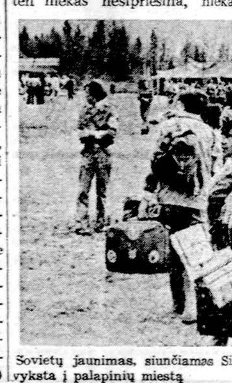
Sovietų jaunimas, siunčiamas Sibiro geležinkelio linijos statybai, atvyksta į palapinių miestą

Elitas tebekartuoja taikos žodį. Tai raktas į populiarumą, tai ginklu žvangančio konkurento sunaikinimas, tai laivokartė į politinį pasisekimą, — bent taip manė daugelis ką tik rinkimus pralaimėjusių... Taika, taika, taika. Didžiausia gi taiką rasi kapuose, ten niekas nespriešina, niekas