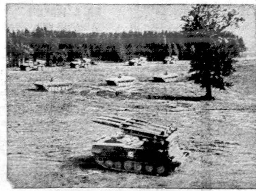
Sovietų judamosios priešlėktuvinės raketos