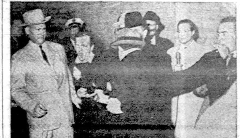
Viena pačių rečiausių nuotraukų, kai Ruby nušauna prezidento John F. Kennedžio žudiką Lee Harvey

Washingtonas. — Praėjus 13 metų nuo prezidento John F. Kennedžio nužudymo, Kongresas atnaujins nužudymo tyrinėjimus. Tam skiriama 4 mil. dolerių ir dveji metai laiko. Kartu tyrinės ir dr. Martin Luther Kingo nužudymo aplinkybes.