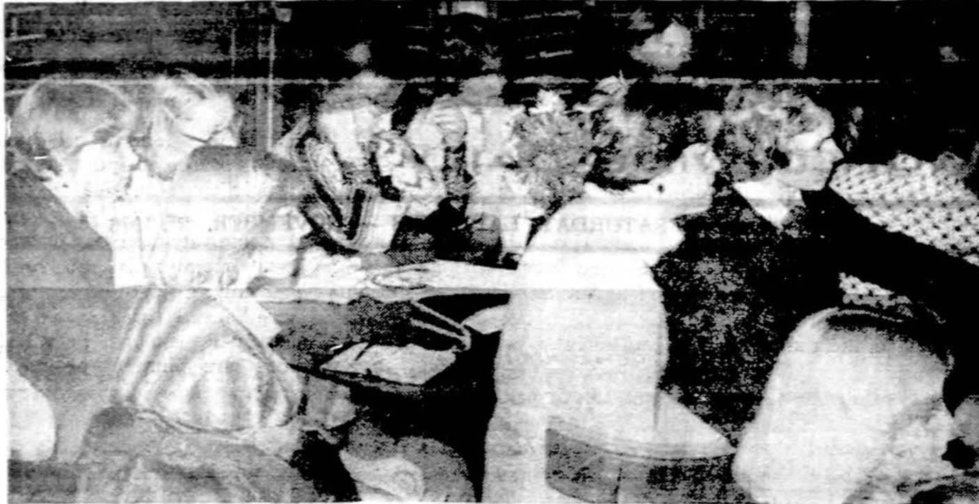
Dalis Chicago studentų ateitininkų fuksų priėmimo susirinkime.

Taip pat tęsėme darbą metinio baltaus ruošos reikalais. Buvo paskelbti įvairūs komitetai: de koracijos, dovanų paskirstymo, spaudos, gėlių. Tada skaidrėmis grįžome į moksleivių ateitininkų ir mokytojų stovyklas Dainavoje. Dar syki pergyvenome smagiai praėjusios