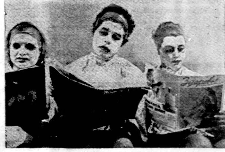
Maskvos grožio salone

Maskva. — "Literaturnaja Gazeta" skundžiasi išlaisvintomis, su vyrais sulygintomis, moterimis. Jos geria, rūko, keikiasi ir visa kita daro kaip vyrai. Jos netenka to, kas vadinama moteriškumu. Į laikraščio redakciją ateina daug vyrų laiškų, kuriuose rašoma, jog jų žmonos vis daugiau panašios į "kovbojus".