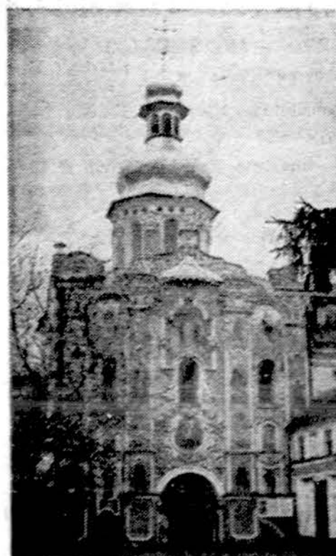
Viena iš tūkstančių tokių ortodoksų šventovių, senosios architektūros šedevyrų, bolševikų destrukto, paversta sandėliu

Dvasinis gyvenimo džiaugsmas "Šventieji nė kiek nėra praradę savo reikšmės ir dabartiniame moderniajame pasaulyje. Šventieji yra pavyzdys moderniam žmogui kovojant su nusistovėjusių ipročių konformizmu, tų ipročių, kurie dažnai yra laikomi teisingais vien dėl to, kad jie žmogui patogūs. Šventieji savo pavyzdžiu mum nurodo, kaip reikia atsikratyti tingumo ir pasyvumo; šventieji mums atskleidžia dažnai mūsų užmirštą dvasines ir moralines vertybes; šventieji nurodo mums dvasinį gyvenimo džiaugsmą bei grožį ir priartiną prie Dievo", kalbėjo neseniai Paulius VI.