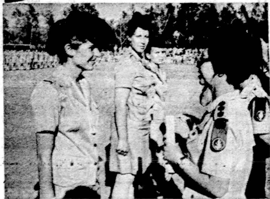
Israėlio valstybės vadai, nujausdami, kad vėl reikės kariauti, stiprina karines pajėgas, mobilizuojami ir moteris. Dešinėje matome aukšto rango karininkę, instruktuojančią naujokas.

1977 m. naftos įvežimas gali siekti ne daugiau, kaip 11 bil. dol. Ypatingos priemonės naudojamos skatinti mažųjų ir vidutinių pramonės įmonių gamybą bei gaminių išvežimą. Mokesčių priežiūra sustiprinama ir baudžiamai pajamų klastotojai. Valdžios organizacija pertvarkoma, decentralizuojama, kai kurios vyriausybės funkcijos perleidžiamos vietos savivaldai.