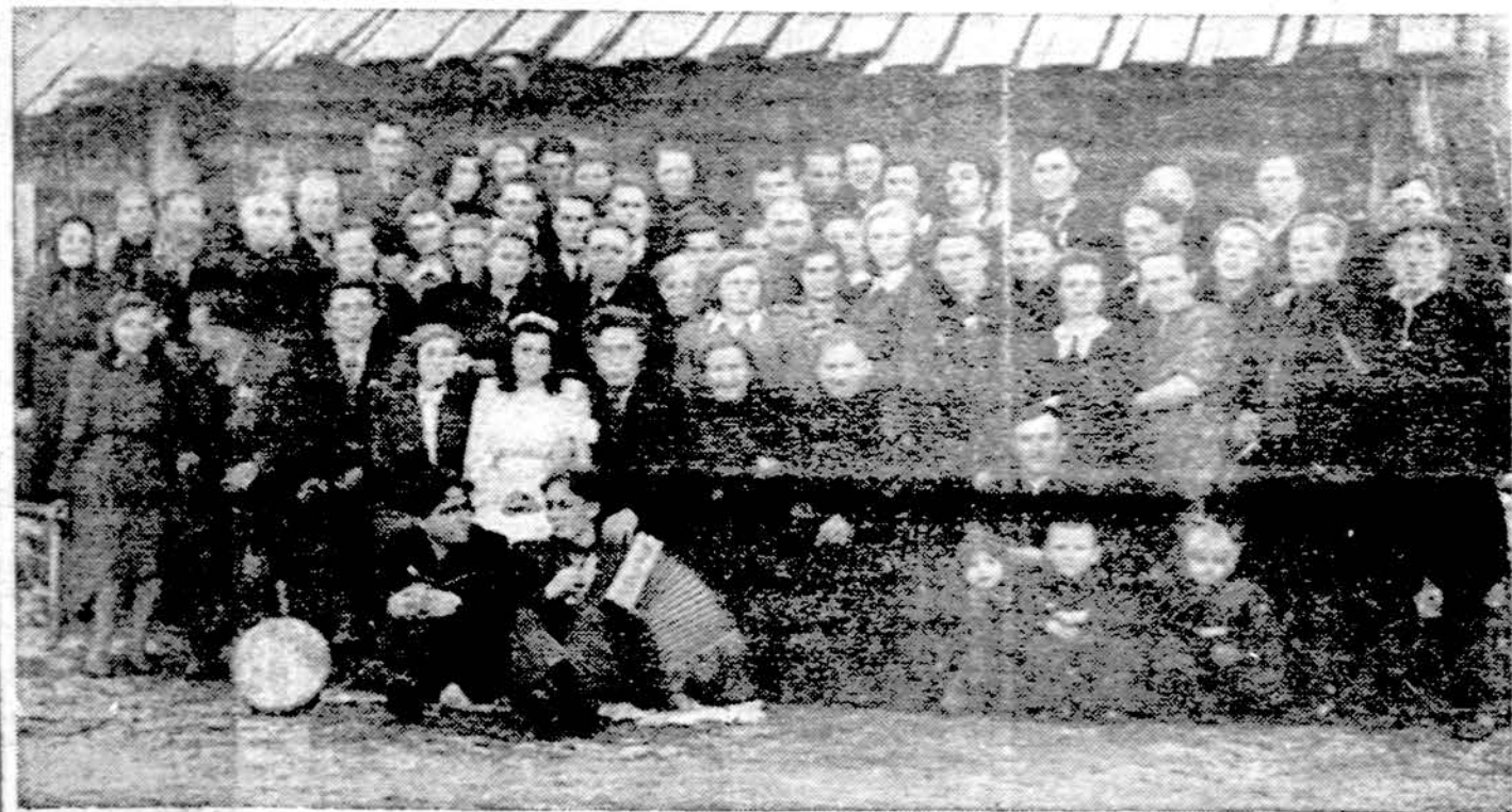
Lietuvių vestuvės Sibire. Pažymėtina data: 1955 lapkričio 20. Tai viena iš nedaugelio nuotraukų, liudijanti mūsų brolių tremtinių gyvenimą svetimoj šiaurėj. Tokių nelaimingųjų, išvežtų į Sibirą nuo 1941 birželio mėnesio buvo apie 300,000. Tik maža dalis jų grįžo po Sta lino mirties.

Londonas. — Darbielių vyriausybė rengiasi nusileisti Valijos ir Skotijos nacionalistams ir toms provincijoms suteikti plačias savivaldas.