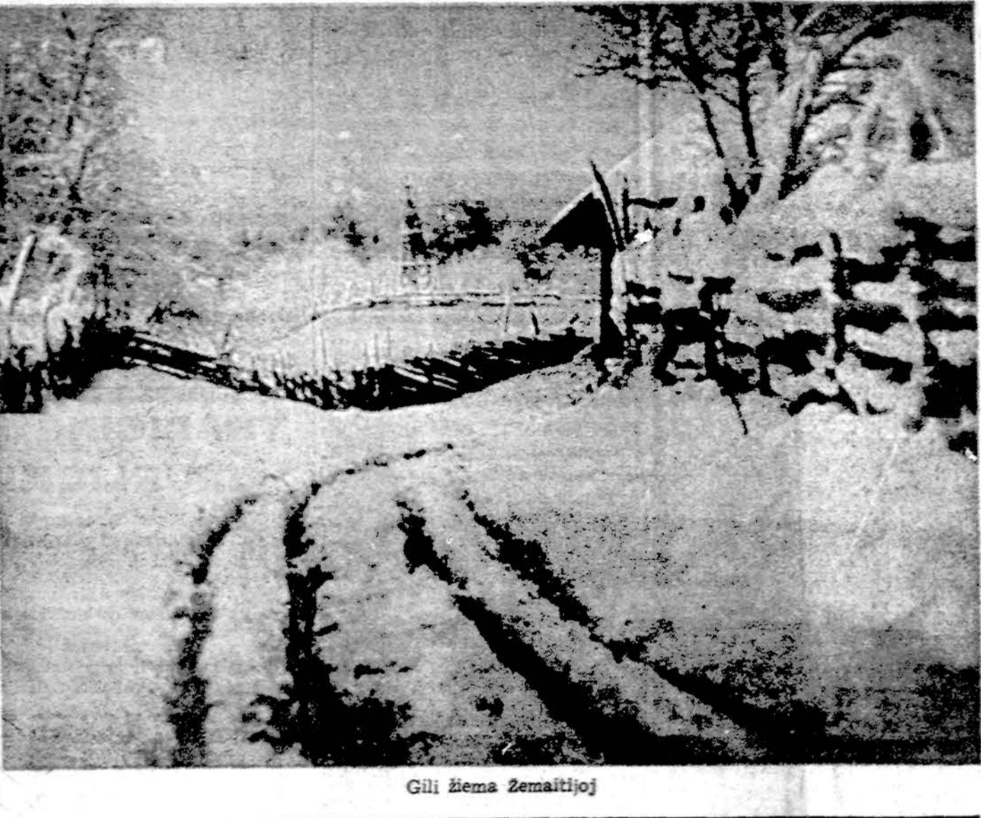
Gili žiema Zemaitijoje

Iškilimėse dalyvavo ir Italijos prezidentas Giovanni Leone. Roma. — Romoje buvo susirinkę trisdešimt slovakių kunigų, besirūpinančių Vakarų Europos kraštuose gyvenančių slovakių sielovada. Susirinkimo tikslas — aptarti slovakių religines problemas.