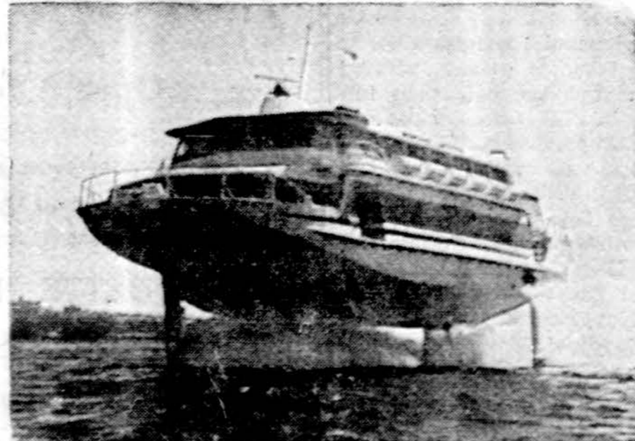
Skrajojantis laivas — hidrofoila, Seattle vandenyse. Labai patogi ir greitai susisiekimo priemonė.

MEKSIKOS MIESTAS. — Amerikiečiai kaliniai Meksikoje paskelbė jau trečią bado streiką, reikalauja greičiau vykdyti kalinių pasikeitimo programą.