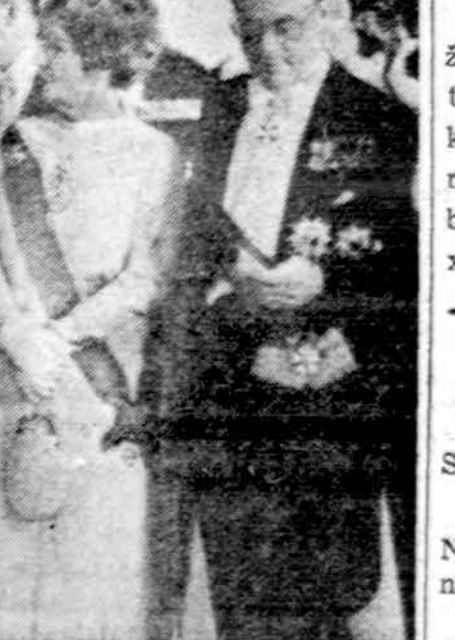
Olandijos karalienė Juliana ir jos vyras princas Bernhard, pridarys rūpesčių karališkajai šeimai. Jis kaltinamas iš Lockheed priėmęs 1.1 mln. dolerių kyšių.

Washingtonas. — Tokia šalta žiemos pradžia Amerikoje buvo tik prieš 96 metus. Šaltis pasiekė ne tik vidurinius vakarus ir Amerikos rytines sritis, bet ir pietvakarius iki New Mexico.