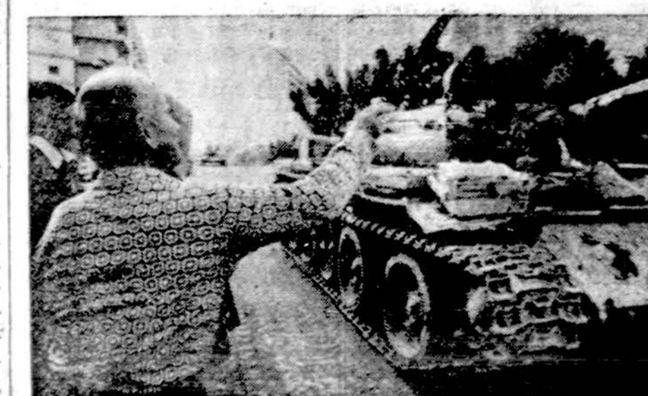
Beirute gyventojai šiltai sutinka Sirijos kariuomenę

Meksikos Miestas. — Naujasis Meksikos prezidentas Jose Lopez Portillo paskyrė ir naują ambasadorių į Ameriką. Juo bus Hugo Margain, dabartinis ambasadorius Britanijoj.