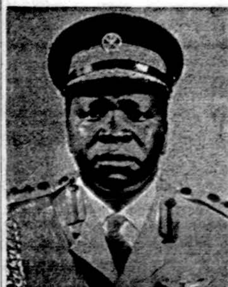
Idi Amin, vienos dienos Hawajų "karaliumis"