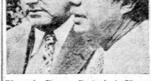
Pirmasis Jimmy Carterio ir Henry Kissingerio susitikimas užsienio politikai aptarti

Gerų žodžių Kissingerio adresu pasakė britų užsienio reikalų ministras Anthony Crosland ypač už jo paskutinę misiją Afrikoje, kai sugebėjo įtikinti Rodezijos ministrį pirmininką Ian Smith pradėti derybas su juodaisiais nacionalistais ir valdžią perduoti juodųjų daugumai, išvengti didelio masto civilinio karo. Su juo atsivertinti Crosland žadėjo šiandien, kai sekretorius apsilankys Britanijoje ir abu lankysis futbolo (soccer) žaidynėse, ką Kissingeris, kilimui iš Europos, labai mėgsta.