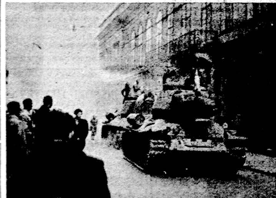
Revolucija prieš Sovietų atneštą revoliuciją. Vengrų ginkluotos pajė-gos Budapešte 1956 metais