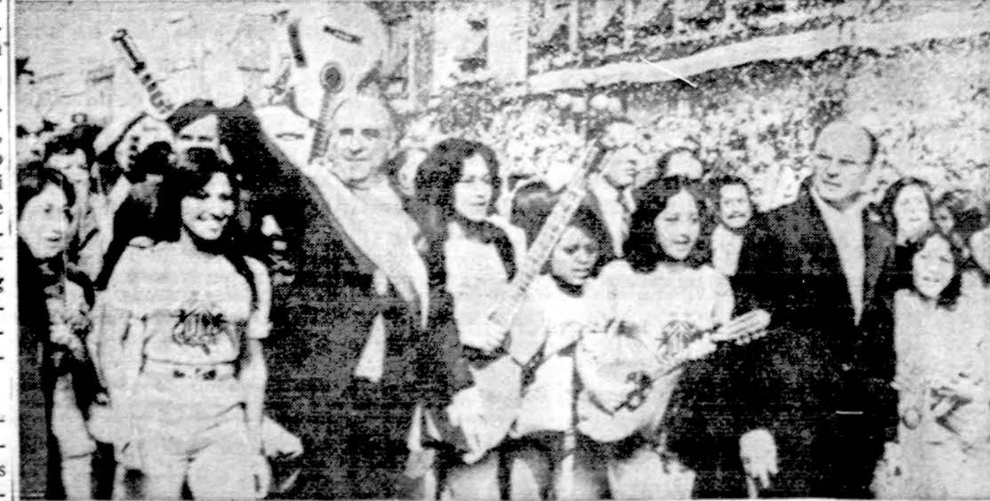
Meksikos naujasis prezidentas Lopez Portillo (iškelta ranka) po iškilmingos inauguracijos Meksikos Miesto gatvėse. Dešinėj buvęs prezidentas Luis Echeverria