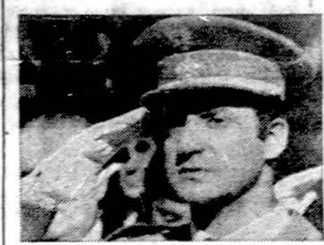
Ispanijos karalius Juan Carlos parodė didesnę sugebėjimą tvarkyti valstybę nei kas tikėjosi

Madridas. — Ispanijos komunistų partijos vadovas Santiago Carrillo Madrido miesto centre buvo suaukęs slapta spaudos konferenciją, pranešė, kad jis čia nelegaliai gyvena jau 10 mėnesių. Būsimuosiuose 1977 metų rinkimuose komunistų partija taip pat bandys savo jėgas, išstatis kandidatus visose apygardose.