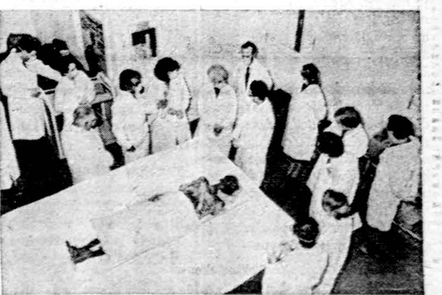
Garsaus Egipto Faraono Ramzes II-jo mumija, 3200 metų amžiaus, buvo į Paryžių atvežta parodai, tačiau nelaukta ji pradėjo pūti. Archeologai ir kiti specialistai stengiasi ją apsaugoti nuo tolesnio gedimo

Tas pats laikraštis spėja, kad James Schlessingeris vėl bus CIA direktorium. Tas pareigas trumpą laiką turėjo ir Nixono administracijoje.