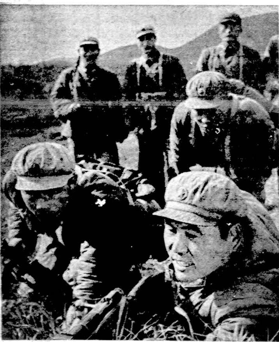
Kinų kareiviai karinių užsiėmimų metu

Gruodžio 14: Alfredas, Otilija, Trainaitis, Zvangutė. Gruodžio 15: Celinus, Kristina, Kovotas, Vingilė. Saulė teka 7:08, leidžias 4:20. ORAS Daugiausia saulėta, šilčiau, apie 40 laipsnių.