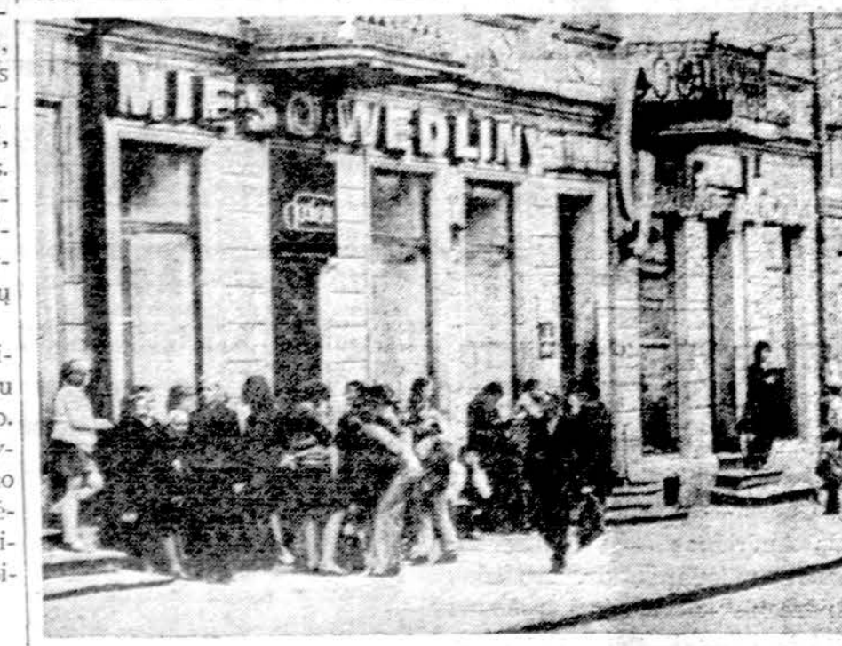
Kaip sunkiais karo metais. Pirkėjų eilės prie krautuvų Plocke, komunistinėje Lenkijoje.

Jugoslavijos užsienio politika yra išimtina Tito rankose. Nuo 1948 m., kai jis nutraukė ryšius su Maskva, jis mėgino užsienio politikoje laikytis vidurio, kurį jis pavadino nesidėjimu su nieku. Ideologiniu atžvilgiu jis artimesnis komunistams, negu Vakarams. To nepaisant, komunistinės Albanija ir Bulgarija siekia atplėšti dalį Jugoslavijos žemių. Tito mėgino tapti trečiojo pasaulio vadu, bet nesėkmingai. Bet jam pavyko užsitikrinti pagalbą