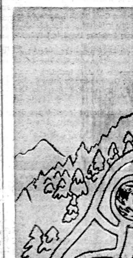
Piešė Edvardas Tuskenis, Marquette Parko lit. m-los 7 sk. mok.

Vieną gražų šeštadienį mes išvažiavome į Kolorado slidinėtį. Mes slidinėjome nuo didelių ir mažų kalnų. Tai vieta vadinosi Vail. Ten buvo daug kelių, kurie kėlė slidininkus į kalnus.