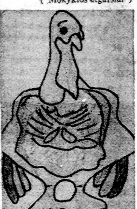
Padėkos dienos simbolis. Piešė Vilija Bubiūtė, Clevelando Vysk. M. Valančiaus lit. m-los IV sk. mok.