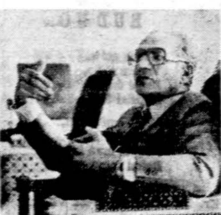
Irano Sachas Reza Pahlewi aiškina, kodėl jis pakėlė naftos kainą.

BENDROSIOS KOVOS BARE Žūtbutinė kova su nuožmiu, jokių nuolaidų nedaranti okupantu turi būti vykdoma globaliniu mastu. Negana to, kad paskirų kraštų organizacijos ar ryžtingų kovotojų grupės tą kovą remia: jų veikla teapima tik ribotą skaičių žmonių, net ir jų tarpe iškyla įvairių nesupratimų, pragaištingo jėgų ir laiko eikvojimo tarpusavio ginčuose. Tad vienos, visą veiklą vienijančios, visam išlaisvinimo darbui vadovaujančios institucijos reikimas yra reikalingas ir būtinas.