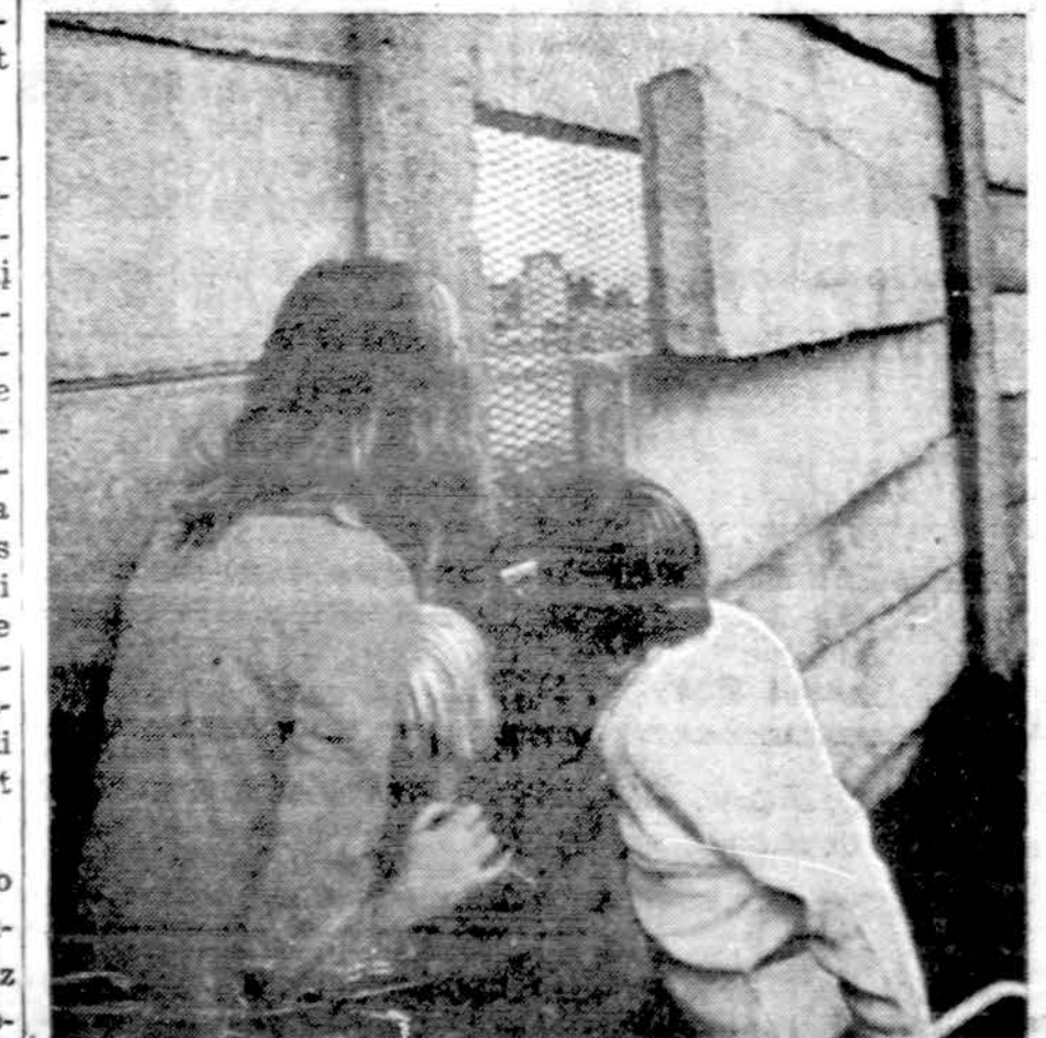
Kas gi ten darosi komunistiniam rojui? Vakarų Berlyno vaikai žvelgia į Rytų Berlyną pro cementinės gėdos sienos plyšį

bažnyčių lankymo, viešai susidėgino. Tas įvykis visuomenę labai sukrėtė. Iki šiol tik šeima ir šiaip taip bažnytinis gyvenimas dar nebuvo paliesti valstybės kontrolės. Kaip ilgai išliks ir ton dvi institucijos nekontroliuojamos, niekas nežino. Varžtai Bažnyčiai jau pradėdami jausti.