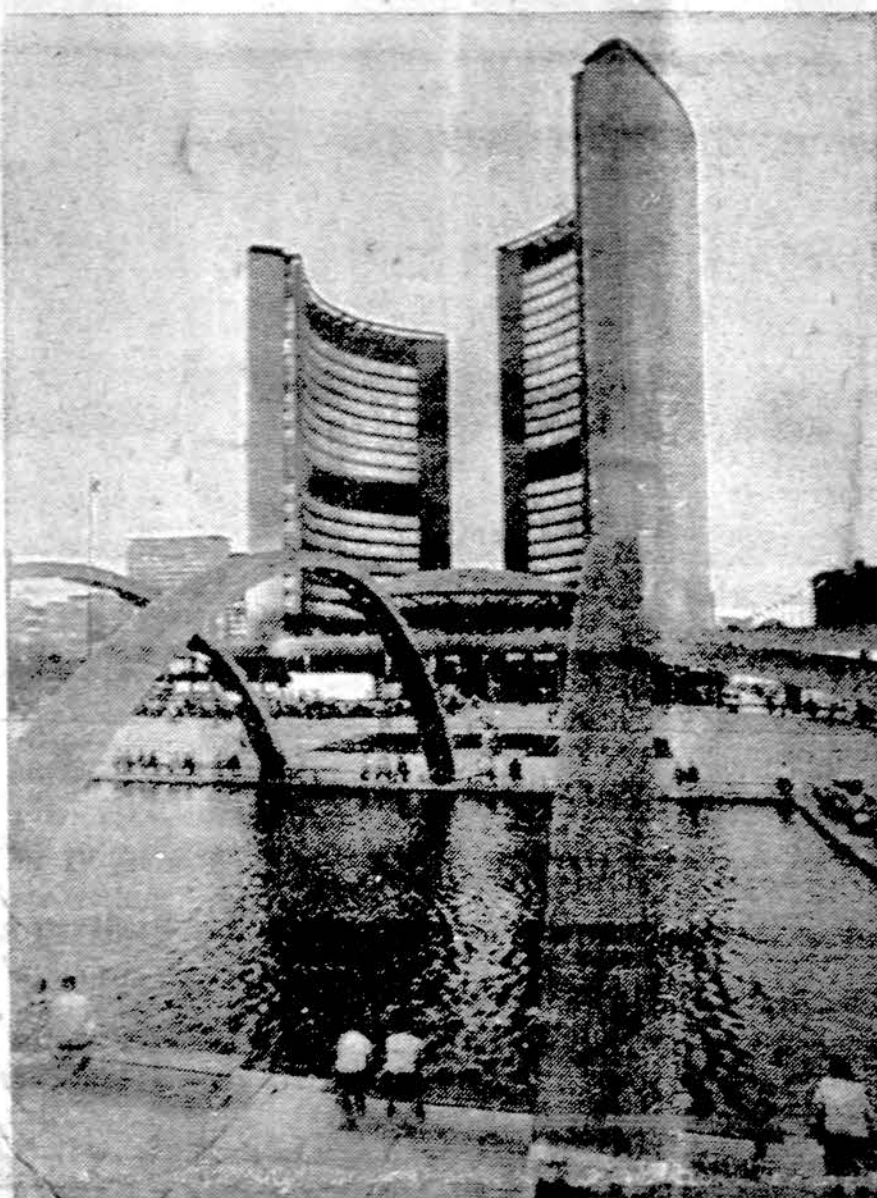
Toronto, Kanadoje, miesto rotušė