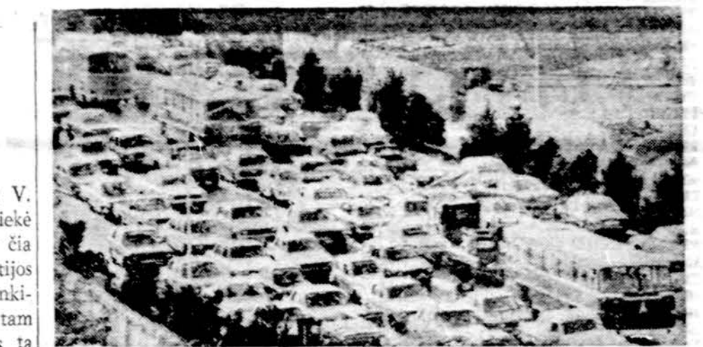
Iranas, turėdamas savo krašte milžiniškus naftos kiekius ir juos aukšta kaina parduodamas užsieniams, pastaruoju metu labai praturtėjo. Automobilių Teherane kaip Amerikoje...

Komunistų vadai netikėtai bu-vo užpluti stiprios opozicijos. Jie turėjo numatyti pakeitimus iš-sėlninti arba juos visai atmeti. Vietoje nesuardomo broliškumo su Sovietų Sąjunga įrašė: Lenki-ja sustiprina draugystę ir bend-radarbiavimą su Sovietų Sąjunga ir kitomis socialistinėmis valsty-bėmis. Komunistų partija pripa-žinta kaip vadovaujanti politinė pajėga socialistinio statyboje, bet