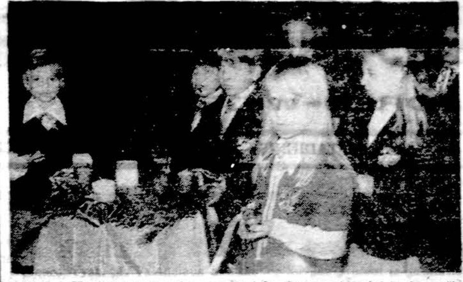
Cicero Vysk. M. Valančiaus ateitininkų kuopos jaunieji ir jaunučiai adventinio susikaupimo metu atneša adventinį vainiką.