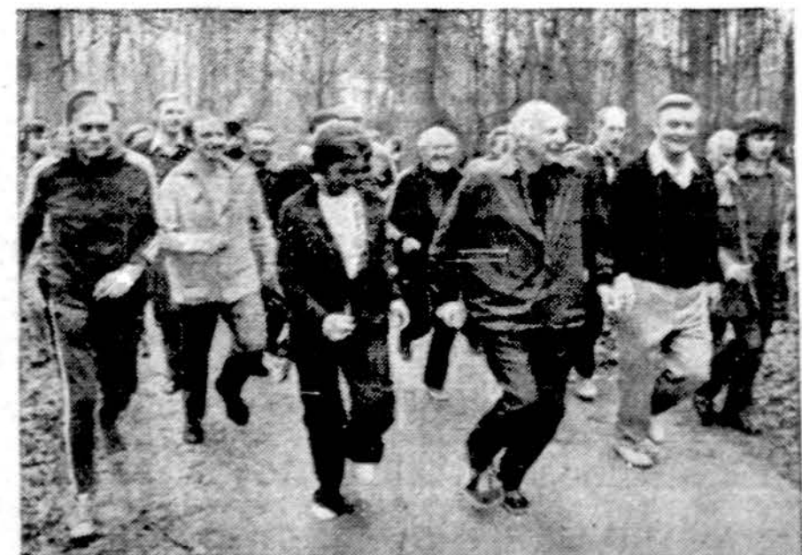
Vakarų Vokietijos prezidentas Walter Scheel yra neišdidus valstybininkas ir tautos labai mėgiamas. Nuotrauką jis viename parke suruošų „lenktynių“.

New Yorkas. — Patricia Hearst, už užstatą paleista ir laukianti antro teismo, kalbėdama per CBS televiziją, paskutiniiais žodžiais iškoneivė Symbionese Liberation Army, o apie tuos, kurie iš jų žuvo 1974 susišaudyme su policija, pasakė: „Jie gavo, ką buvo užsitarnavę“.