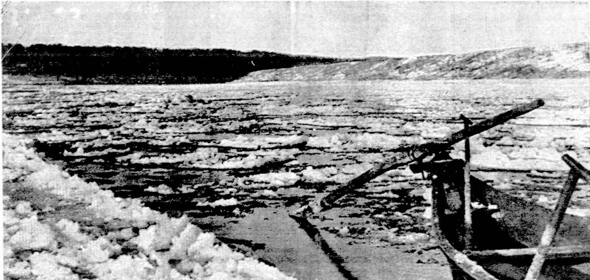
Izas Nemune ties Alytumu

Addis Ababa. — Afrikos žemynė yra 43 milijonai katalikų ir 23 mil. stačiatikių. Iš tų stačiatikių daugiausia gyvena Etopijoje, viso 16 mil., Egipte 3 mil. Jie daugiausia priklauso graikų stačiatikių Bažnyčiai.