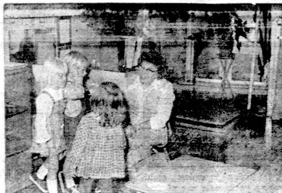
Kriaučėlinių vardo Montessori namelių mokiniai pokalbį su savo mokytoja.

× Pardavimui — Baltic prekybos ūkyje auginti: antys, žąsys, jauni paršukai, kiaulės — gyvi arba šviežiai papjauti. Pagėdaujant visi mėsos produktai išrūkom. Užsakymams skambinti telef. 323-1510 arba 737-6784 (sk)