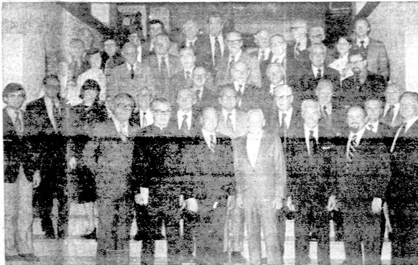
Vyriausio Lietuvos Išlaisvinimo Komiteto seimo, įvykusio 1976 gruodžio 4-5 d. Shoreham Americana viešbutyje, Washington, D.C., atstovai ir svečiai.

Čilės prezidentas gen. Augusto Pinochet sakė, kad jis ėmėsi tos iniciatyvos pasikeisti kaliniams ir tuo reikalu kreipėsi į Ameriką, prašydamas tarpininkauti. Pradžioje sovietai išsiskundė ir dėl šio atsakymo, paskui sutiko. Tokiu būdu prisipažino, kad ir pas juos yra politinių kalinių. Antras Čilės kalinys komunistas pasiūlytas iškeisti į Kubos politinį kalinį. Iki šiol atsakymo negauta.