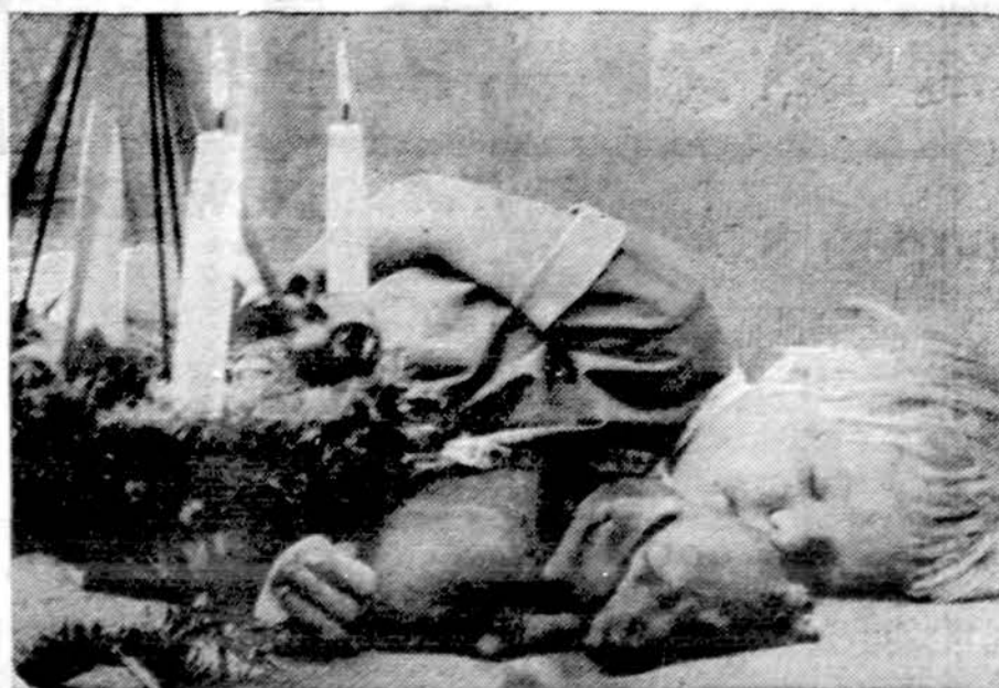
Naktis rami, naktis šventa,

Vos tik buvo sužinota apie suėmimą, komunistai suorganizavo demonstracijas ir skelbia streikus. Komunistų ir jų simpatikų Ispanijoje priskaitoma apie 100,000.