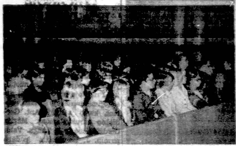
Clevelando Šv. Kazimiero lituanistinės mokyklos mokiniai ir mokytojai bažnyčioje.