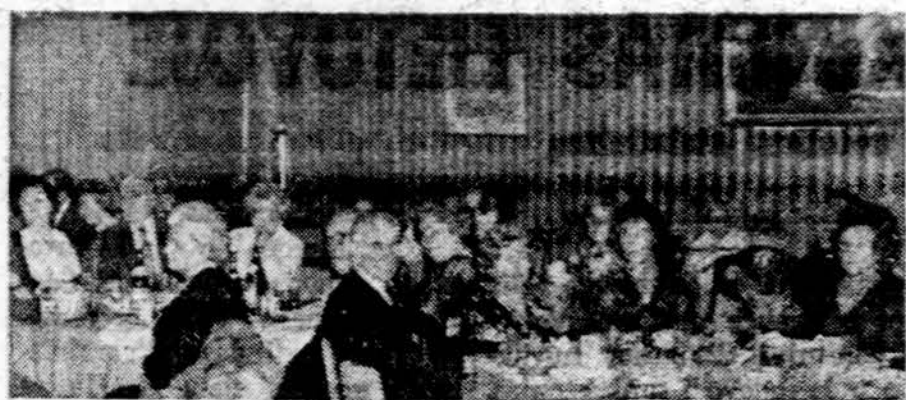
Svečiai Birutės d-jos surengtame baluje Tautinių namų salėje Chicagoj

Užsakymus siųsti "Drauga" adresu, Illinois valstijos gyvenotojai prideda 5% mokesčių.