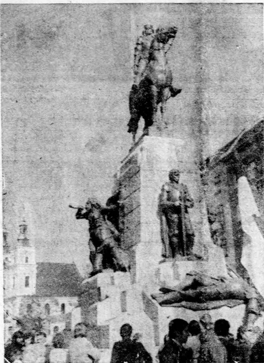
Atstatytasis Žalgirio paminklas Krokuvoje. Viršuje raitas Jogaila, prieky matomas Vytautas, po jo kojoms kryžiuočių komturas, kairėje lietuvių karys, pučiantis ragą. Originalus paminklas 1939 vokiečių buvo susprogdintas

Rekonstruojant paminklą, figūros buvo atgabentos helikopterio pagalba. (dn)