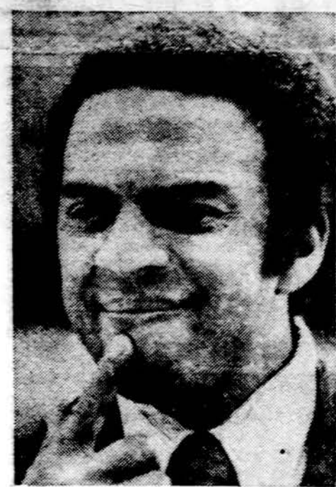
Andrew Young, Carterio paskirtas naujuoju Amerikos ambasadorium Jungtinėse Tautose

Daugiausia apsiniaukus, 60% galimybė sniego, apie 25 laipsnius.