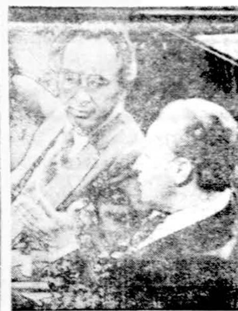
Izraelio ministrai Peres ir Rabin aptaria valstybinius reikalus

Grįžęs į Kauną, šiuo klausimu pasikalbėjau su man gerai pažį-stamais lietuvišais žurnalistais. Kai aš jiems pasakojau, ką esu girdėjęs, kad vokiečiai kaltina lie-tuvius žydų žudymu, į tai man vienas iš jų atsakė: