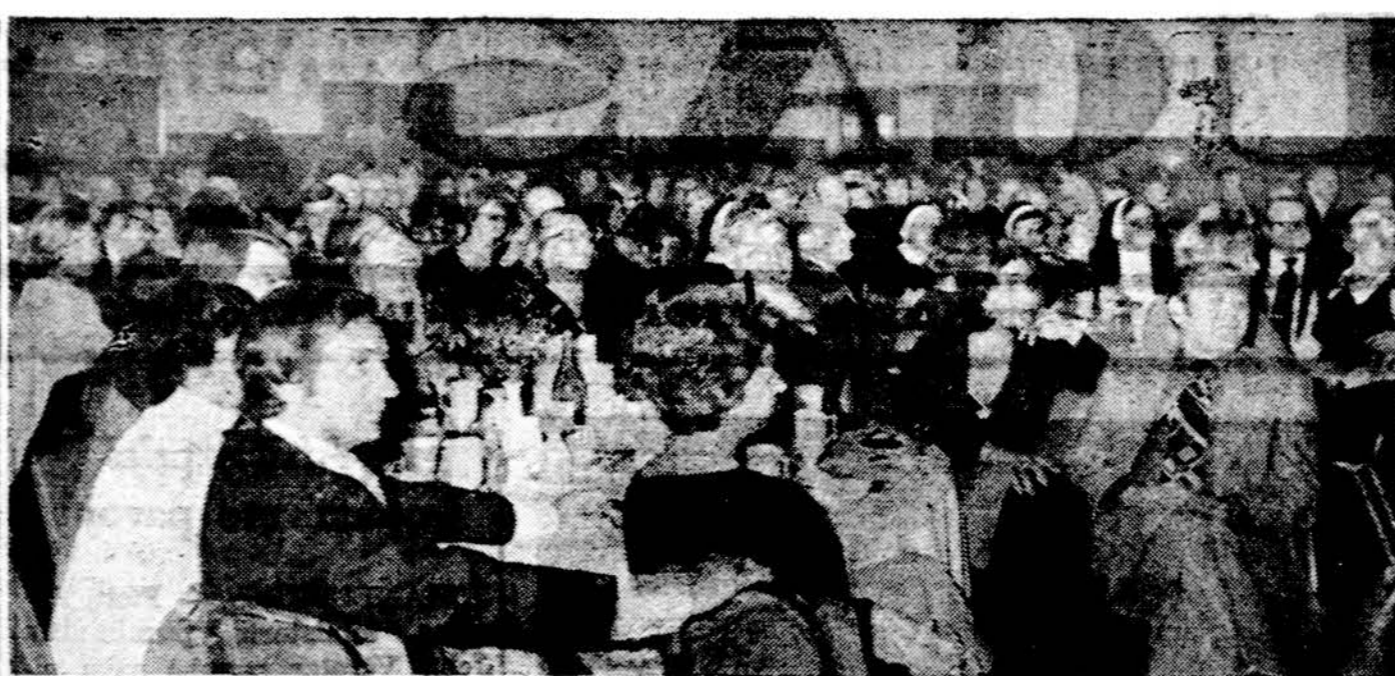
Los Angeles lietuviai parapijos salės atidarymo koncerto metu.