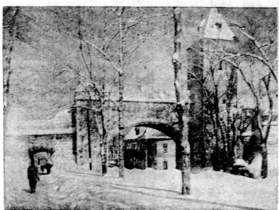
Quebec City, Kanadoje, žiema

WASHINGTONAS. — Amerikos ūkininkų skaičius mažėja, bet ūkių plotai didėja. 1976 ūkių skaičius siekė 2,7 mil., arba 30,000 mažiau nei pernai. 1977 metais, apskaičiuojama, vėl 26,000 ūkininkų parduos savo ūkius.