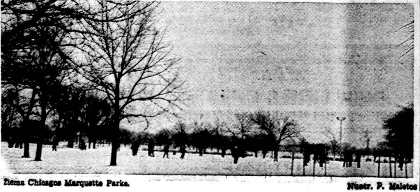
Ziema Chicago Marquette Parke.