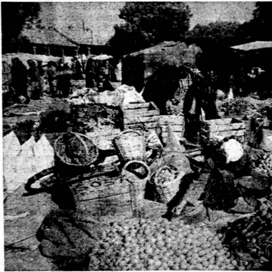
Turgus Azrou mieste, Maroko valstybėje

— Pranašesnio žmogaus kelias yra trigubas: doras — laisvas nuo aistros, išmintingas — laisvas nuo painiavos, drąsus — laisvas nuo baimės savim pasitikėti. Konfucijus