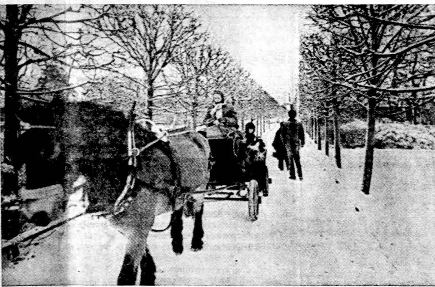
Pirmasis sniegas Stockholme

Nustatyta, kad paukščiai nepakyla aukščiau 1,500 jardų, bet žemiau jų masės. Anksčiau buvo mėginta paukščius gąsdinti specialiu i magnetofono juostelę prašytu ju išgąsčio šauksmu, bet šis būdas gan greitai buvo suprastas. Kanadiečių elektrinis "Sakalas" turi atstoti garso signalą. Šis i sakalų panašus ir garšą skleidžiantis suprojektuotas taip, jog gali būti valdomas iš žemės ir pakeliamas i reikiama aukštį bei nukreiptas pasirinkta linkme. Baigiantis baterijoms, paleidimo bazė gaus signalą, perspės, jog būtina "sakalą" grąžinti i žemę ir naujai užtaisyti.