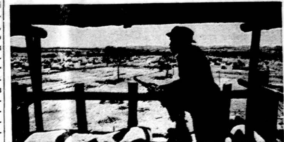
Rodezijos baltųjų vyriausybė nekontroliuoja daugelio vietovių, jas valdo juodieji. Juodosios rasės sargybinis kaimo sargyboje

Paryžiuje išeinantis L'Est Europeen" paskutiniajam savo numeryje (149) ištaisai atsispausdino Pabaltiečių pogrindžio organizacijų atsisaukimą, ryšium su šiu kraštu 35-kių metų okupacijos sukaktimi. (E.)