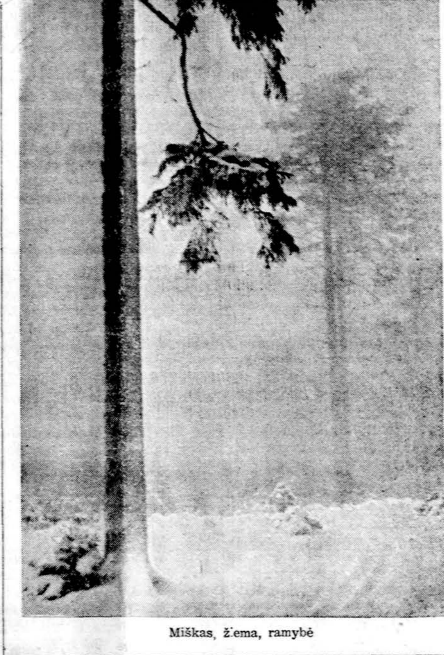
Miškas, žema, ramybė