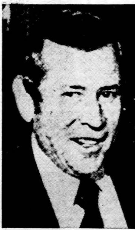
Howard H. Baker, respublikonų vadas Senate

Apsniaukę, ne taip šalta, 40 proc. galimybė sniego, apie 10 laipsnių.