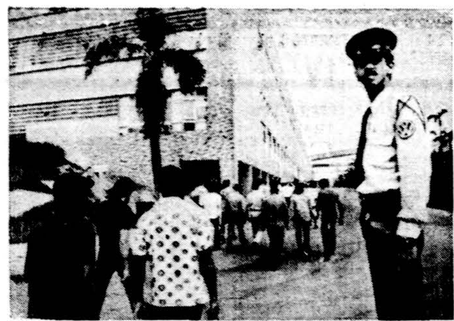
3 milijonus dolerių Vakarų Vokietija investavo Brazilijoje ir pastatė didžiąją Volkswageno automobilių fabriką. Čia matome cinančius ir darbą brazilus darbininkus

stojto. Prasidėjo masinis nedarbas. Valdžios įstaigos ir įmonės jau nebebuvo pajėgios kelti darbininkų gerovės. Infliacija pasiekė pasaulinį rekordą — 450 procentų tą trumpą laiką. Gyvenimo lygis krito. Marksistinė įtaka kas kartas labiau grėse kraštui. Ginkluotų vyrų būriai užpuldinėjo policijos būstines ir kariuomenės dalinius. Ginkluoti susirėmimai tarp saugumo dalinių ir marksistinių būrių jau buvo kasdieninis reikalas. Tūkstančiai kareivių kovojo miestuose, kalnuose ir miškuose su partizanais. Ši kova ypač ilgai tęsėsi Tucumano provincijoje. Daug kas buvo neaugus savo namuose. Kraštutiniai sekvestruodavo pasiturinčiusius, o ypač industrialus, prekybininkus ar atsakingus žymesnius pareigūnus. Reikalavo už jų išsiviničius milijoninių sumų. Daug generolų, aukštųjų karininkų buvo išžudyti. Tūkstančiai intelektualų, pramoninkų, prekybininkų ir kitų pareigūnų slapstėsi išvengti mirties. Krašte kilo panika, 25 milijonai argentiniečių gyveno nežinodami, kas kas bus rytoj, o mažiau pasiturintieji rūpinosi dėl pragyvenimo šaltinių. Iš lūpų į lūpas ėjo gandai, kad turi kas nors nepaprastai įvykti. Pagaliau paskutinę dieną jau viešai visi kalbėjo, laukdami perversmo.