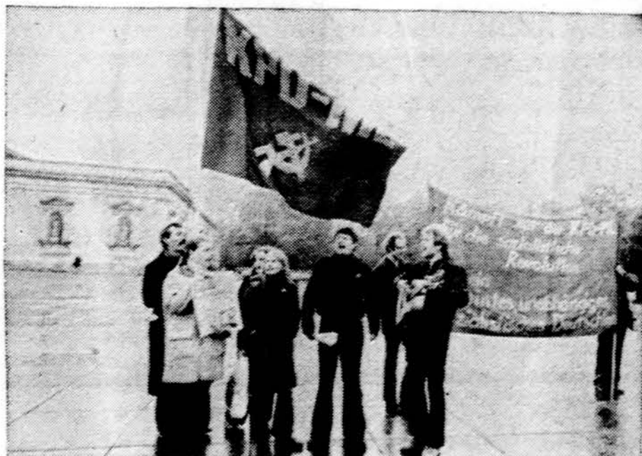
Vokiečiai geriau už kitus vakariečius pažįsta komunizmą, todėl ir procentas komunistų yra pats mažiausias. Šio nuotraukoj keli jaunuoliai komunistai viename Vakarų Vokietijos mieste agituoja už savo partiją, bet nėra kas jų klauso.

Trudeau beveik tikras, kad gyventojai separatistines tendencijas atmes, ir Quebecas pasiliks unijon. Nežinojimas tolimosio provincijos likimo labai kenkia ekonominiam planavimui ir investicijoms.