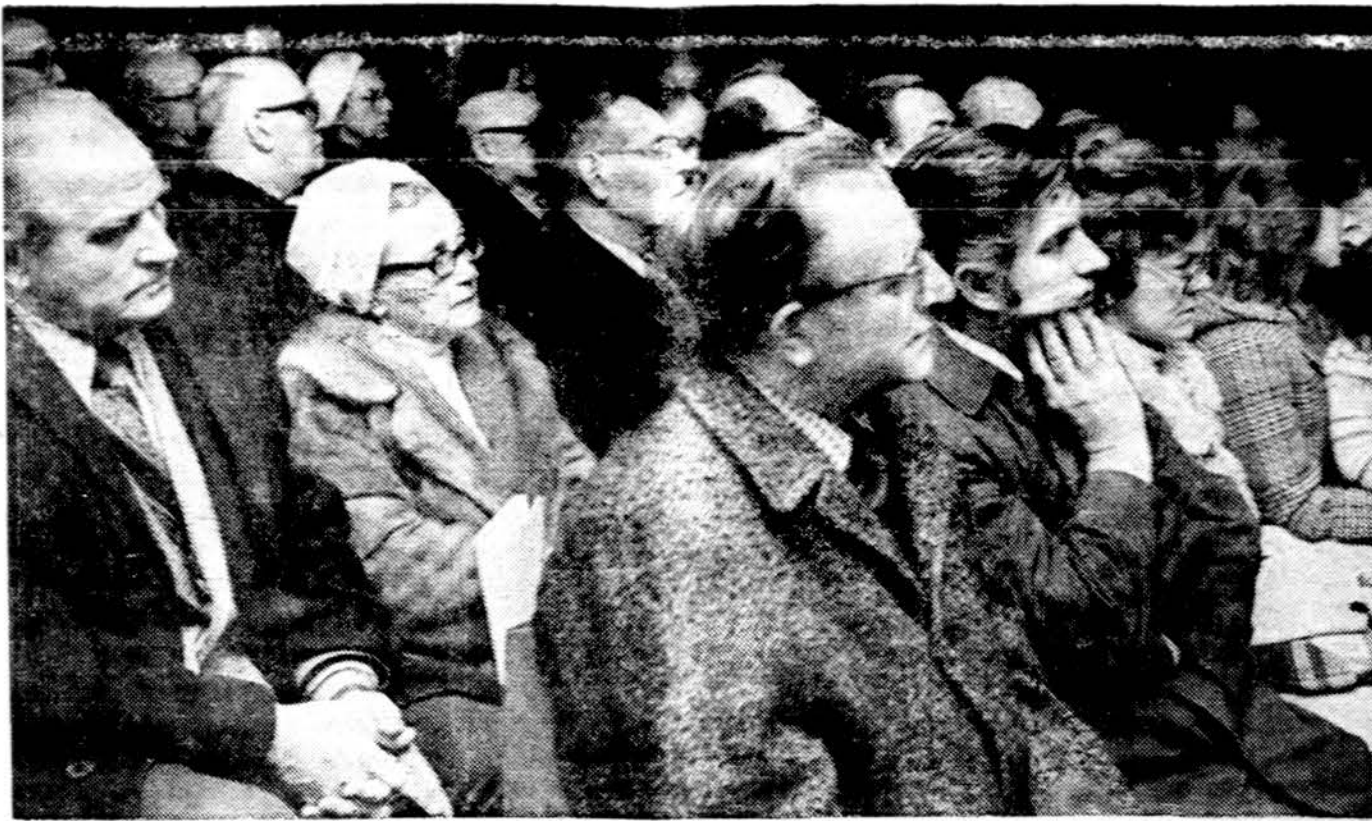
Chicago Nekalto Svč. M. M. Prasišėjimo parapijos bažnyčioj dalis tikinčiųjų sausio 23 d. minint arkivysk. J. Matulaičio mirties sukaktį.