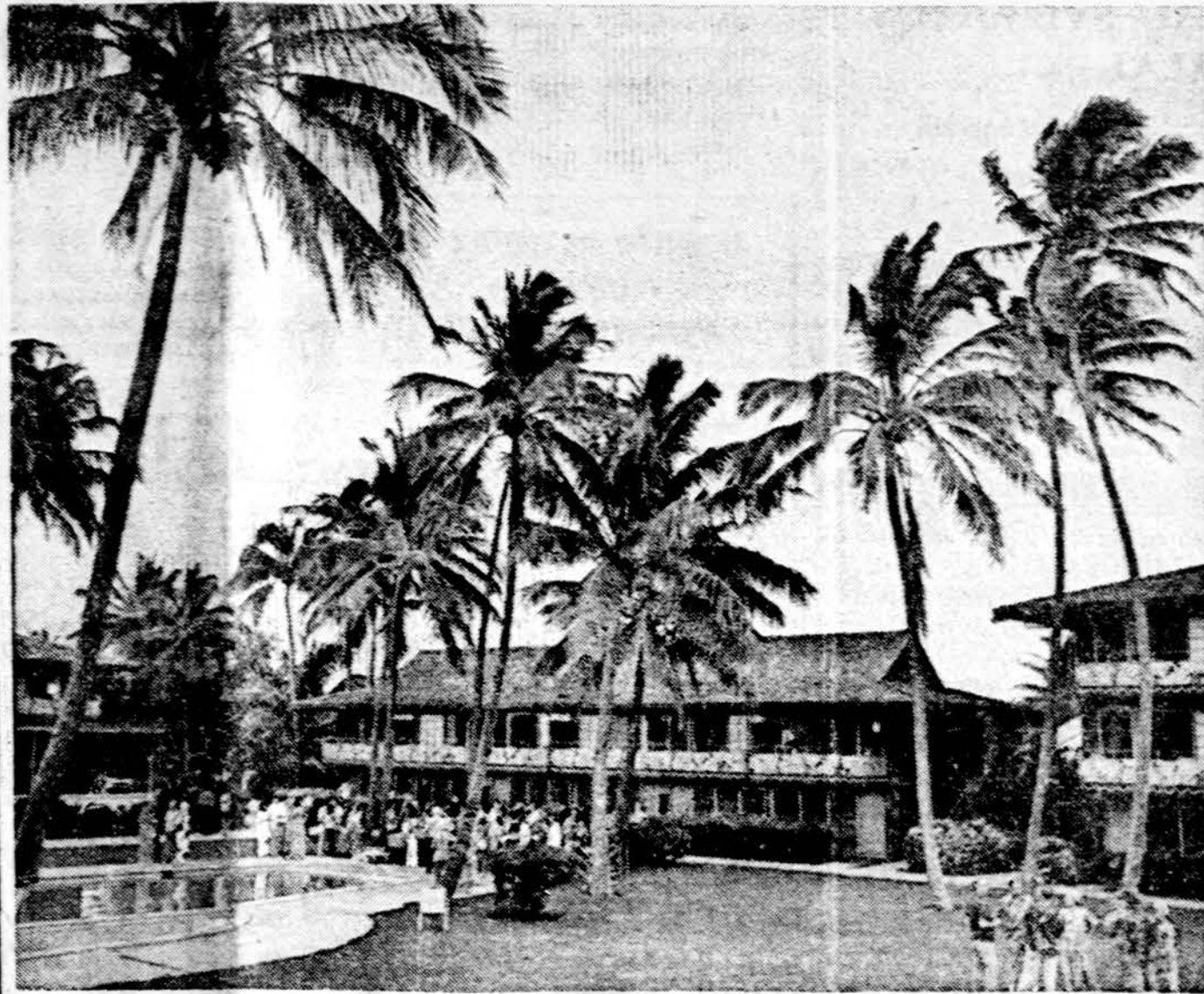
Havajuose, kur amžinas pavasaris