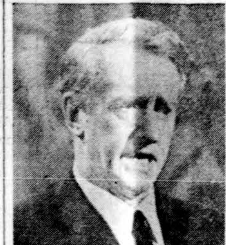
Ian Smith, Rodezijos ministras pirmininkas

MIG-25 į Japoniją atgabeno sovietų lakūnas Viktor Belenko.