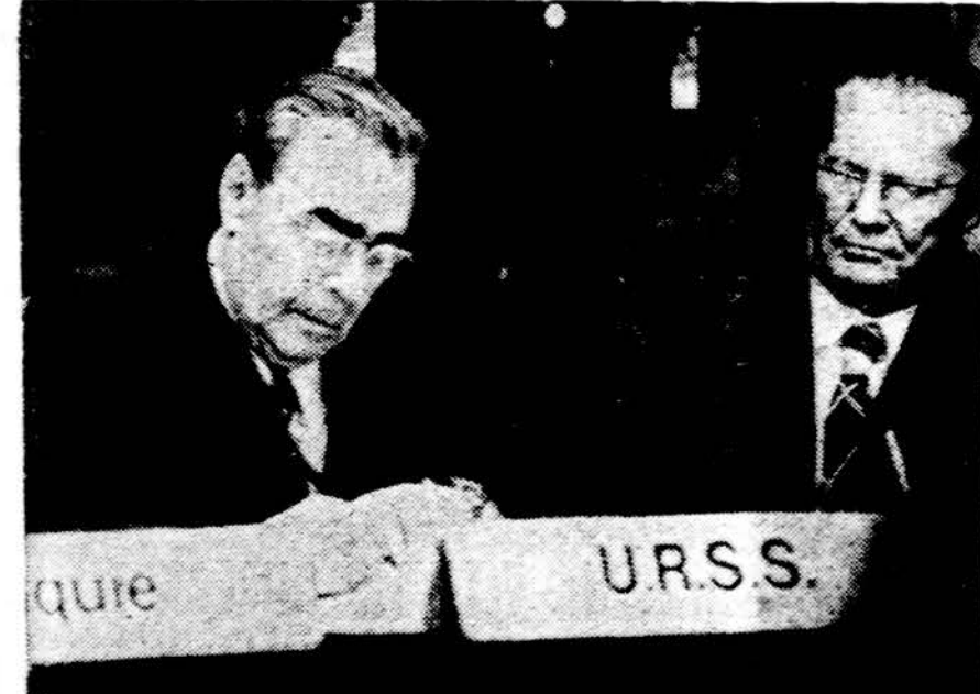
L. Brežnevas Sovietų delegacijos vardu, ašarodamas iš džiaugsmo, kad pavyko apgauti "kapitalistinius kraštus", pasirašo 1975 m. Helsinkio paktą. Dabar visi vakariečiai šį paktą smarkiai kritikuoja ir smerkia, nes jis naudingas tiklat Sovietams.