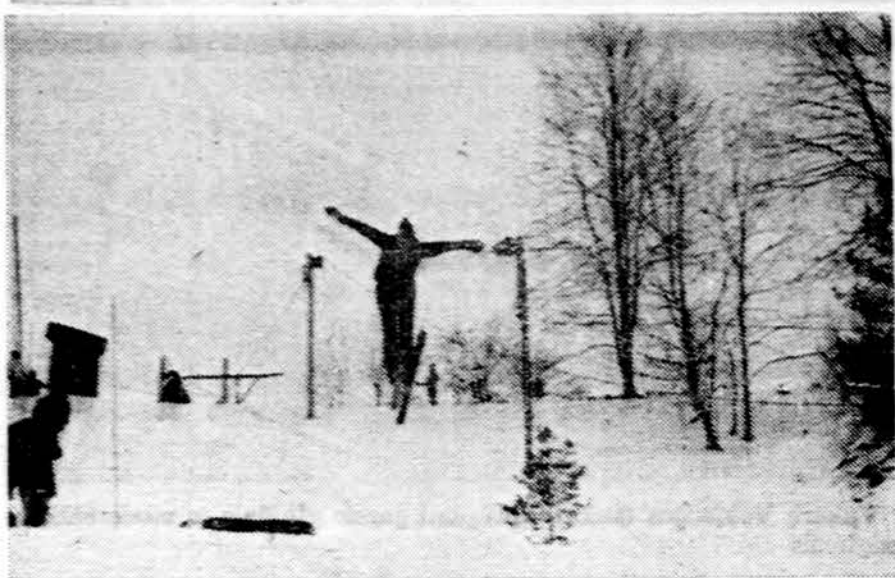
Varžybų metu suolininkas praskrenda mažos pusaitės viršūnę