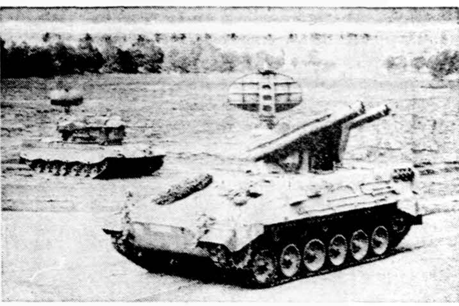
Vakarų Vokietijos tankai, aprūpinti gerais ginklais ir moderniais įrengimais