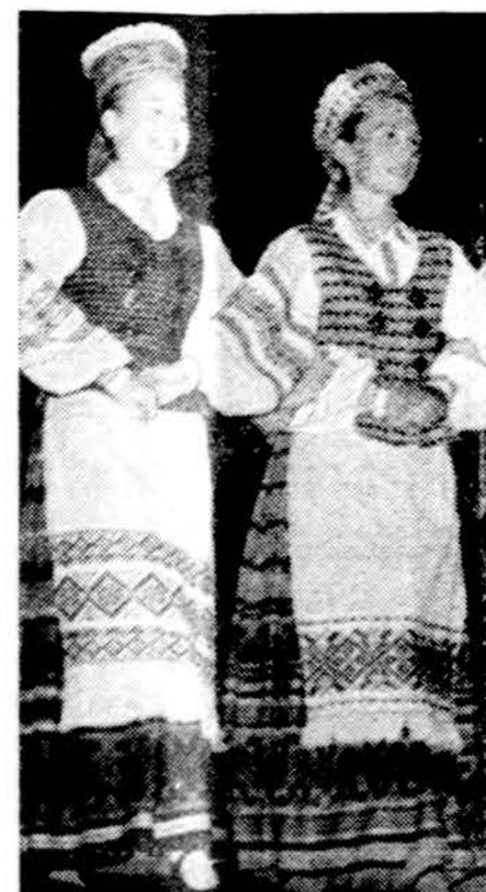
Grandinėlės šokėjos kovo 5 d. šoka Chicagoje, Marijos aukšt. mokyklos auditorijoje. Balandžio 16 d. dalyvauja Grandinėlės labai ruošiamo baltiaus programoje Clevelande. Už savaitės, balandžio 23 su visu 1977 metų lietuviškų šokių kraičiu išvažiuoja į Kanadą, Montreali.

McCormick parodų rūmuose, 23 gatvė prie ežero, Chicagoje, nuo šeštadienio, vasario 26 d. iki kovo 6 d. vyksta automobilių paroda, atdara nuo 11 v. r. iki 11 v. vak. Išstatyta apie 600 įvairių automobilių, sunkvežimių ir kitokių mašinų.