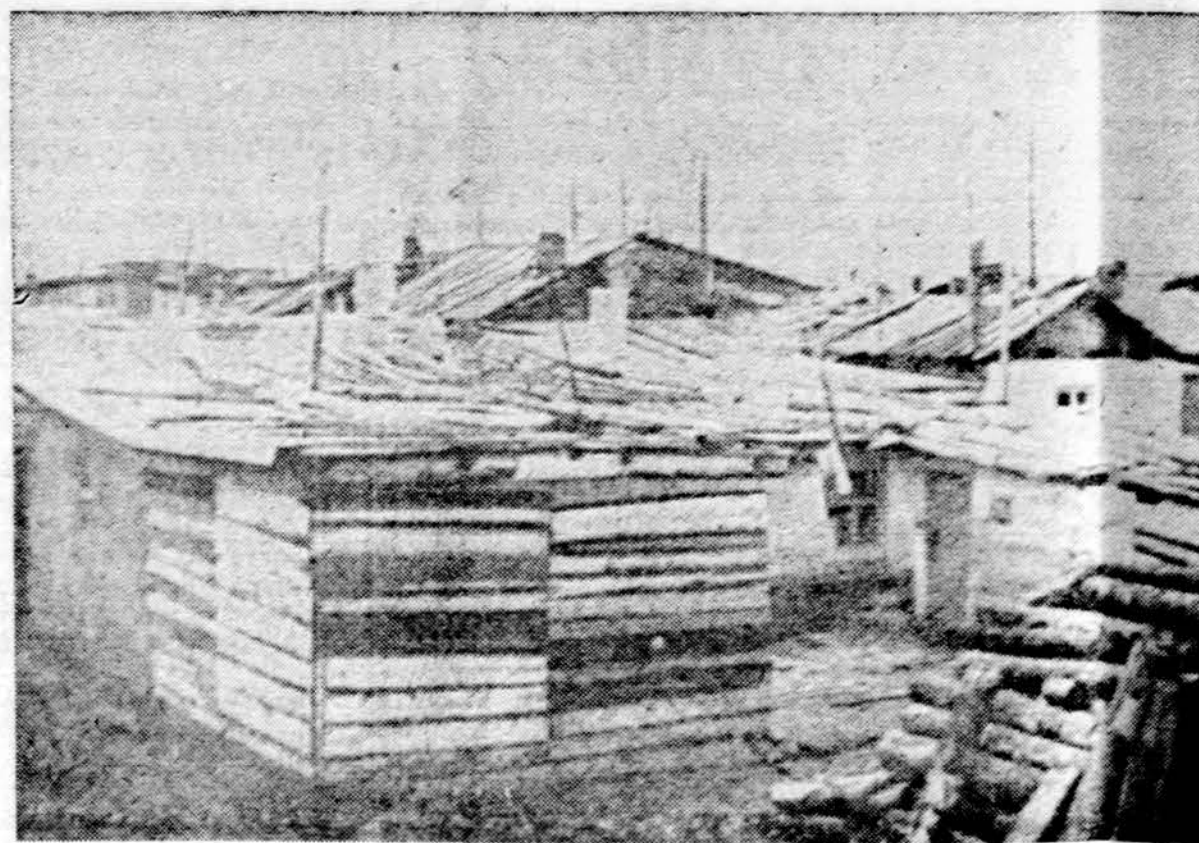
Lišnos, kuriose gyvena Sibiran ištrėmti lietuviai. atlik bausmę koncentracijos stovyklose, bet negavę leidimo grįžti į Lietuvą.

Madridas. — Socialistų darbininkų partija, tik ką gavusi leidimą veikti, apkaltino vyriausybę, kodėl buvo leista legalizuotis ir kitai socialistinei grupei, jos varžovei.