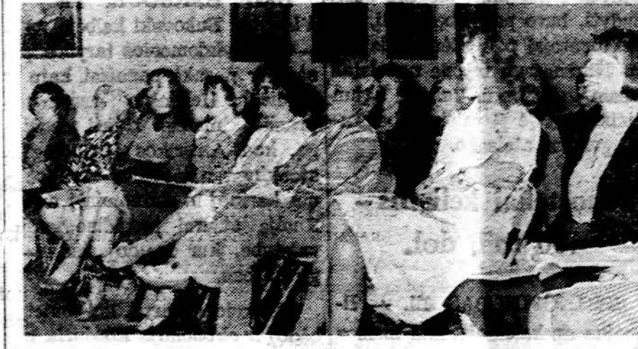
Lietuvių Operos Chicagoje repetiocijų metu vyksta sunkus darbas solis tams, chorui ir meno vadovams, bestatant Gounod "Romeo ir Julijos" opera, kurios spektakliai bus sekancio mėnesio gale.

Vasario 16 d. opera dar turėjo 12,600 dol. skolos. Daugiausia lietuvių spaudai ir kitiems lietuviams, nes amerikiečiams pilnai atsilginta. Taip operos vadovybė, palyginus, ilgame 21 m. egzistencijos kelyje aiškiai pamatė, kad mūsų visuomenė mieliau lan-