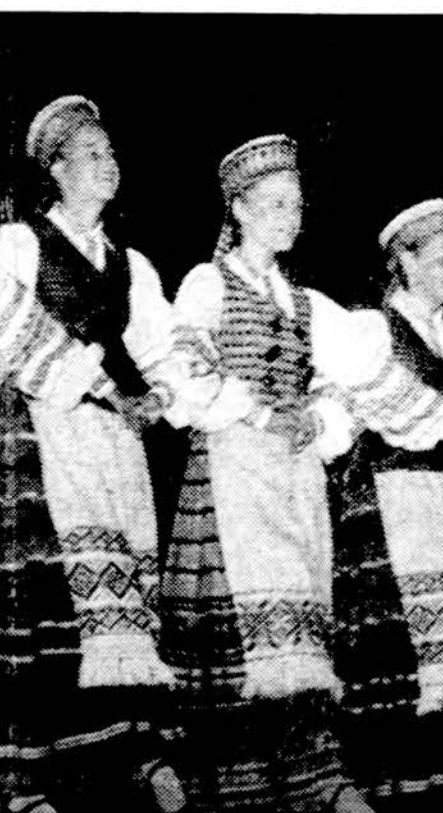
Grandinėlės šokėjos kovo 5 d. šoka Chicagoje, Marijos aukšt. mokyklos auditorijoje. Balandžio 16 d. dalyvauja Grandinėlės labai ruošiamo baltiaus programoje Clevelande. Už savaitės, balandžio 23 su visu 1977 metų lietuviškų šokių kraičiu išvažiuoja į Kanadą, Montreali.

McCormick parodų rūmuose, 23 gatvė prie ežero, Chicagoje, nuo šeštadienio, vasario 26 d. iki kovo 6 d. vyksta automobilių paroda, atdara nuo 11 v. r. iki 11 v. vak. Išstatyta apie 600 įvairių automobilių, sunkvežimių ir kitokių mašinų.