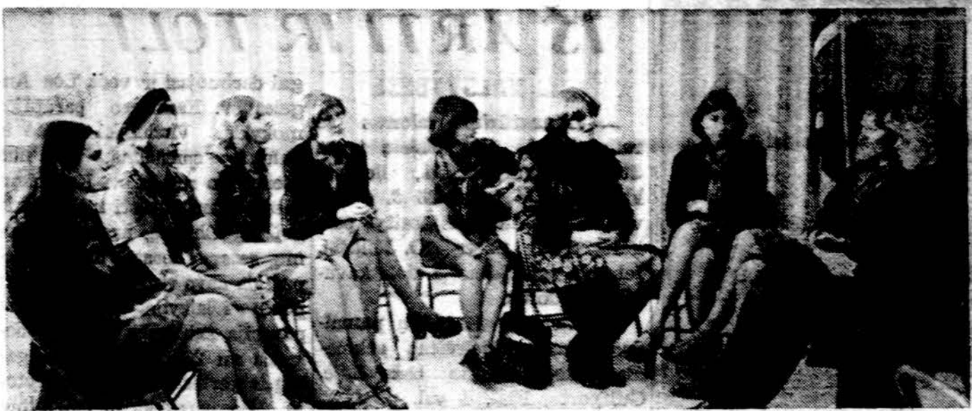
Detroito vyr. skautės pastarime artėjiančios muges reikalais, kuri įvyks kovo 27 d. Kultūros centre.