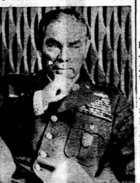
Už kariškai tvirtą Ameriką. Nato vyriausias kariinių pajėgų vadas JAV generolas Haig.

Ar susigundys Sovietai puliti Ameriką ir atominiams ginklais — tai didelis klausimas, į kurį negalėtų dabar atsakyti nei Kremliaus valdovai. Sovietai žino apie galimus atominio puolimo laimėjimus, bet nežino, kas bus po to. Atominių ginklų turi ne vien amerikiečiai su Sovietais, bet jų turi ir kitos valstybės net Europoje. Jei, atsakant į Sovietų puolimą, bus sunaikinti didieji Rusijos miestai, nors vada ir būtų