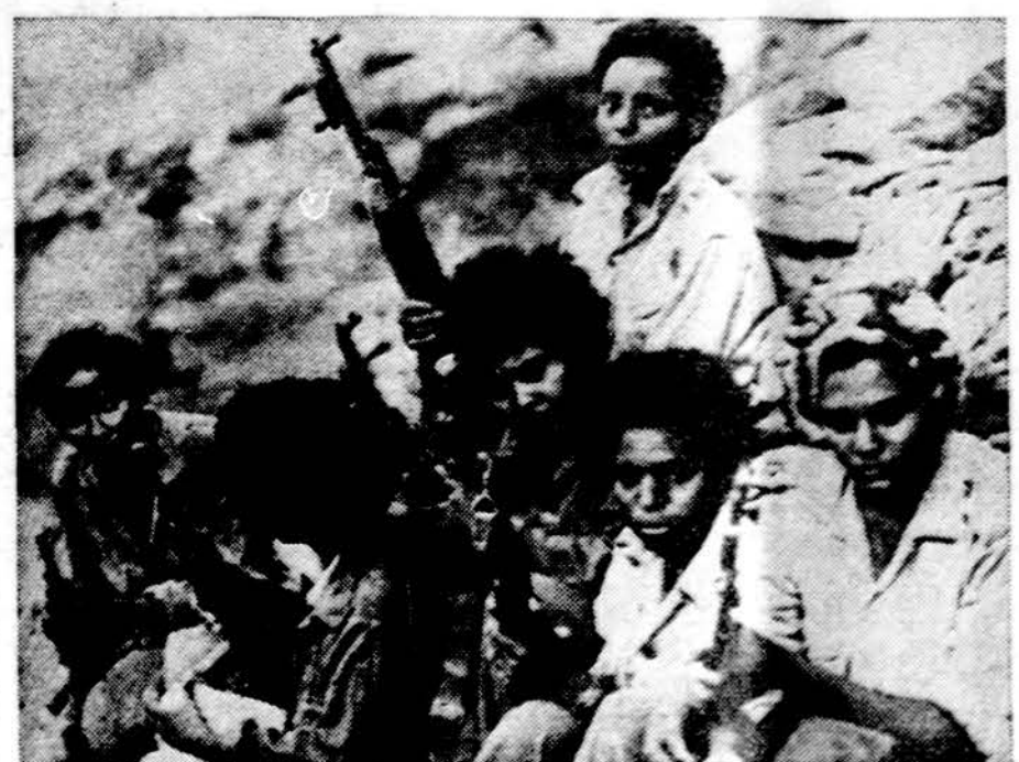
Eritrejos, Etiopijos šiaurinės provincijos, moterys sukilėlės prieš diktatorišką režimą reikalauja nepriklausomybės

Washingtonas. — Amerikiečiai pasiskiepiję vad. „swine flu“, prieš federalinę administraciją jau iškelė ieškinio daugių net 17 mil. dolerių. Mažiausias ieškiny buvo 9.50 dol., didžiausias — 3 milijonai. Iki teismai išaiškins, kiek tuose ieškiniuose yra teisybės, gali praeiti penkeri metai.