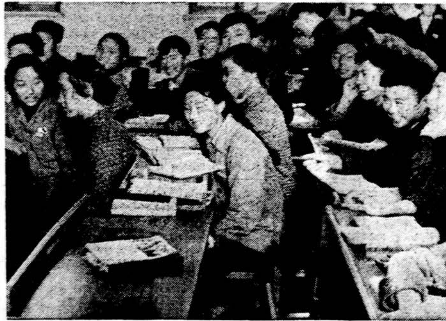
Komunistinės Kinijos studentai paskaitų metu