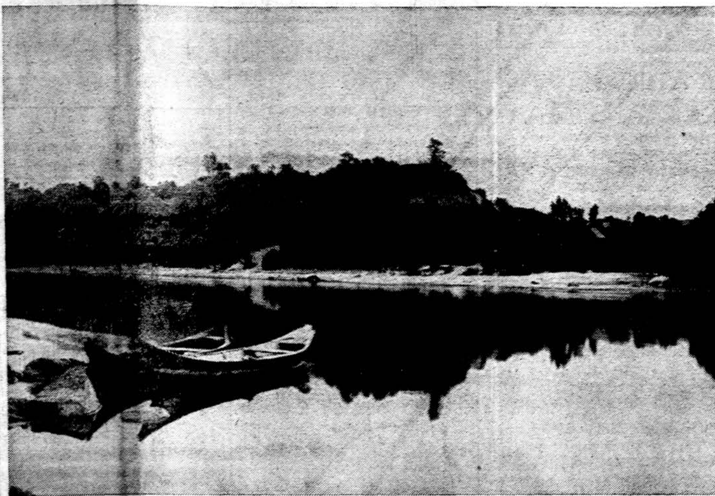
Pūnios piliakalnis, Nemun o ir Puneles santakoje

Mūsų tautiečių kančios Mordovijos, Permės ir kituose lageriuose tegul nuolat budina mūsų sąžinę: ar viską padarėme, kad išklytume tikrais lietuviais ir kad Lietuva būtų laisva? Ar viską padarėme, kad brangiausi mūsų Tautos sūnūs ir dukros greičiau išsvytų laisvę? Ar Čilės komunistai daugiau verti, kad dėl jų išlaisvinimo dedama tiek pastangų?