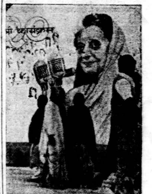
Indiros Gandhi priešrinkimais plakatas

Kai paaiškėjo Gandhi pralaimėjimas, buvo atšaukti visi konstituciniai suvaržymai, nuimta spaudos cenzūra.