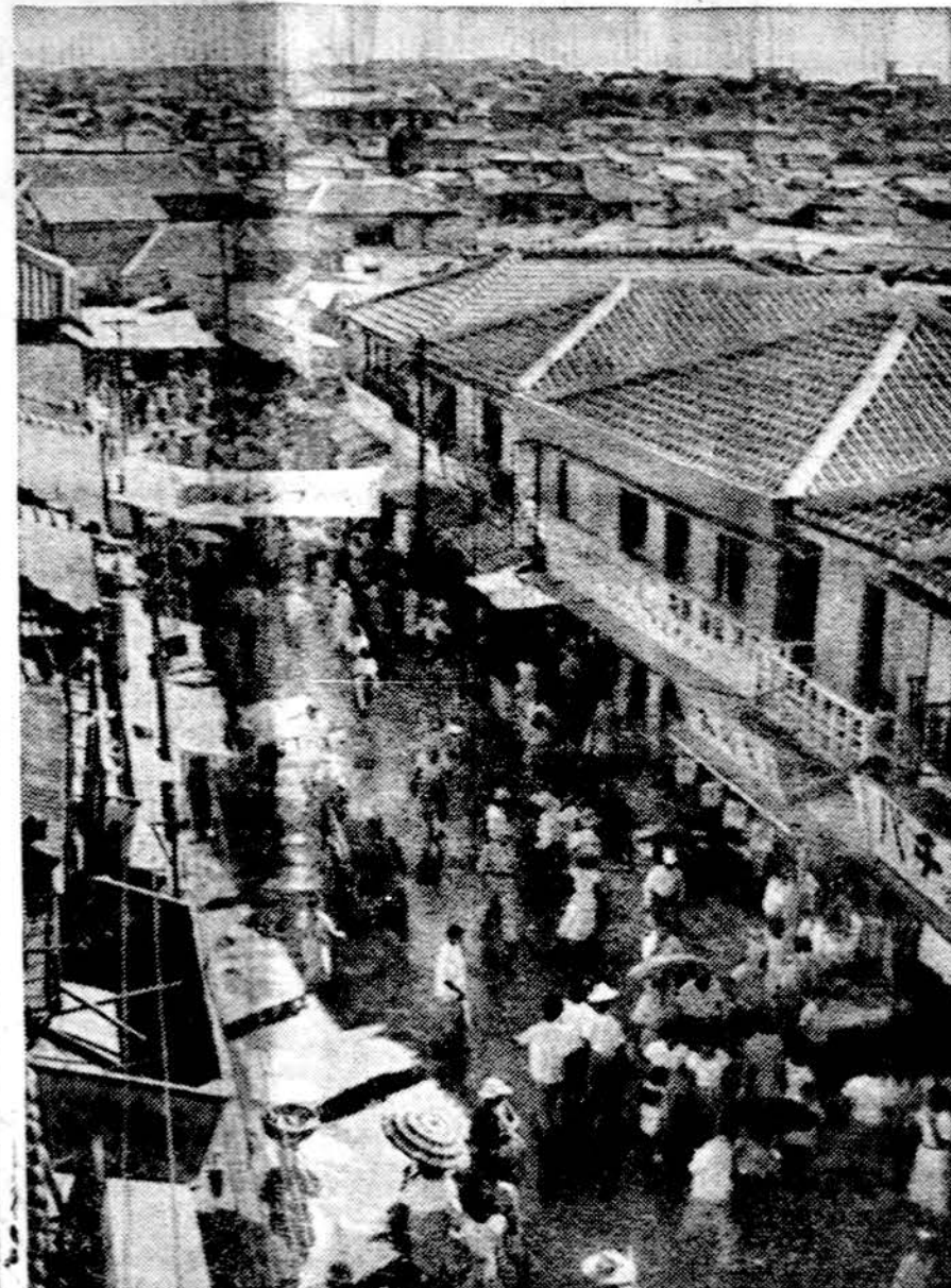
Naha, Okinawos salos svarbiausias miestas. Okinawos gyventojai skundžiasi, kad išsikėlus amerikiečiams ir salą gražinus japonams, gyvenimas labai pablogėjo.