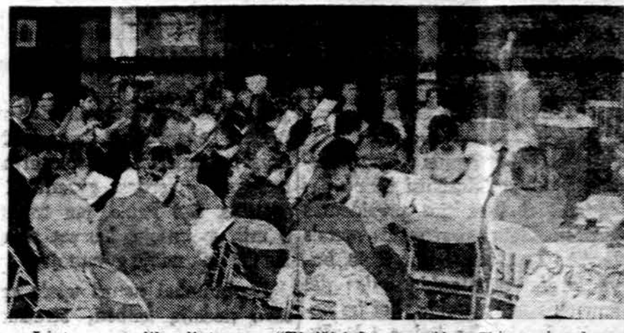
Liet. evangelikų liuteronų "Tėviškės" parapijos Chicagoje choras ruošiasi giesmių vakarui, kuris įvyks parapijos bažnyčioje balandžio 3 d., Verbu sekmdienį, 5 val. po pietų