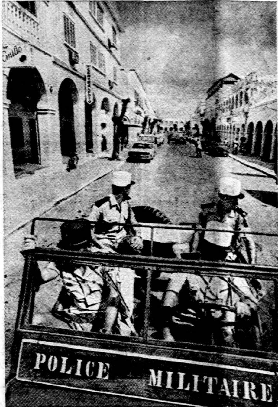
Djibuti, paskutinė prancūzų kolonija rytinėj Afrikoj, ir svetimšalių legiono kariai. Iš tos kolonijos prancūzai ruošiasi išeiti, nori jai suteikti nepriklausomybę, bet graso ją užgrobti Etiopija ir Somalijs

Somalijos diplomatai Vakarų kolegoms sako, kad reikia rasti naują kalbą su Amerika. Kad Somalijs sovietų ginklais apsiginklavo, tai buvo kalti Vakarai, atsakė jį duoti. Jos socialistinė ekonominė struktūra neturi būti kliūtis.