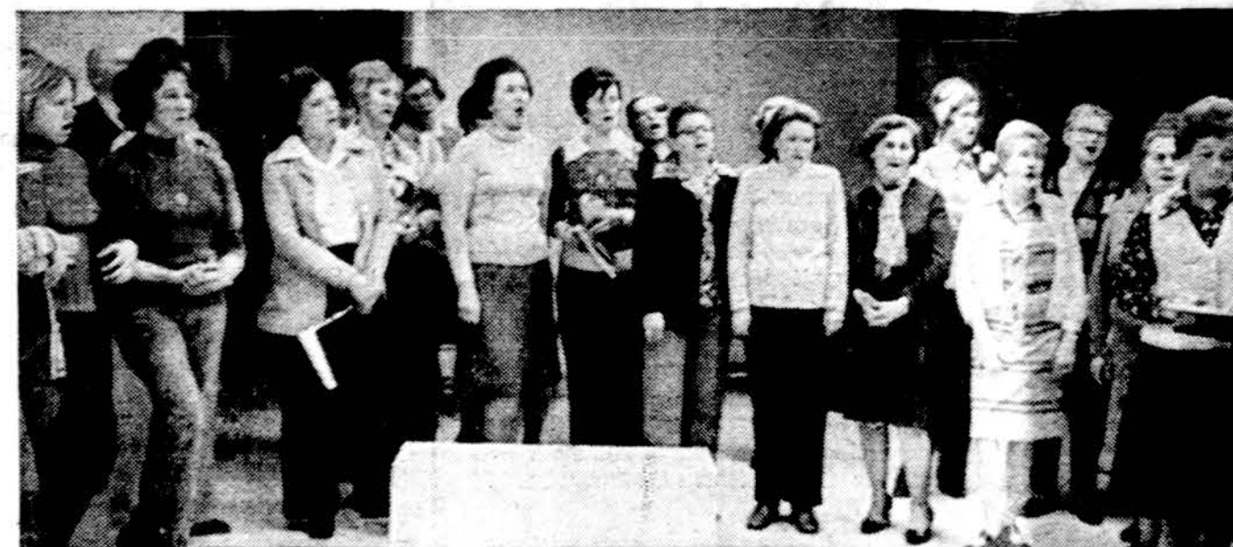
Dainavos ansamblio merginų choras dainuoja, repetuodamas "Kūlgrindos" muzikinį veikalą.