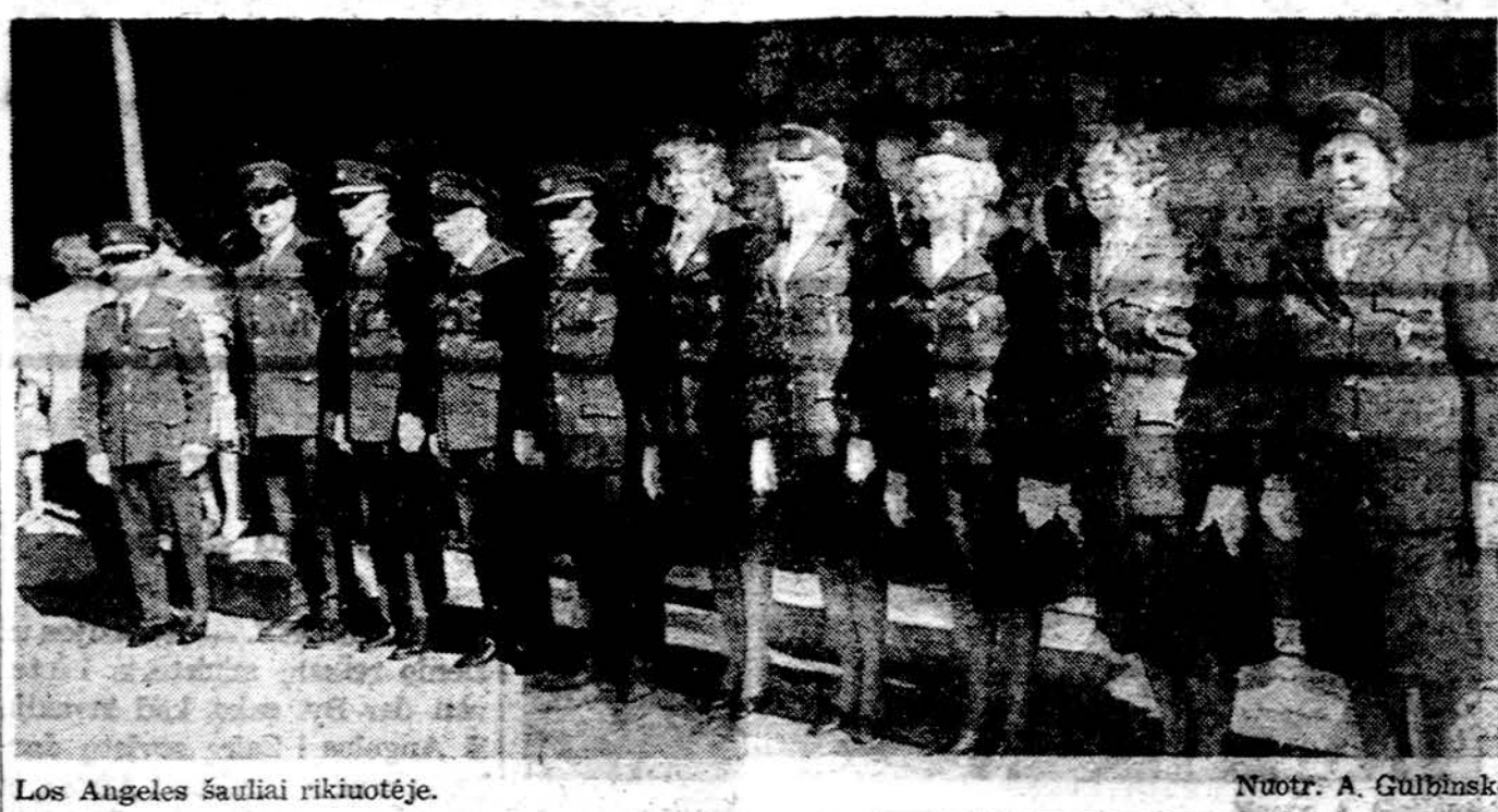
Los Angeles šauliai rikiuotėje.