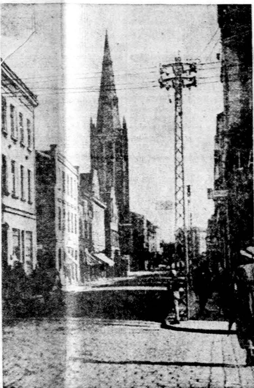
Klaipėda. Laukininkų gatvė su Reformatų bažnyčia