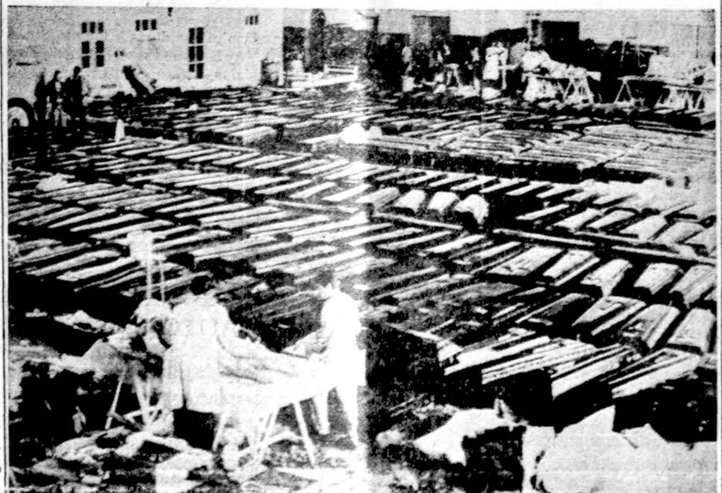
Tea, kur buvo didžiausia istorijoj aviacijos katastrofa, 577 karstai Teneriffe, Canary salų aerodrome

Bostonas. — Pakrančių apsaugos laivas sulaukė ir atsivarė į Bostono uostą sovietų žvejų 275 pėdų su 93 žmonių įgula laivą Taras Ševčenko. Laivas žvejų 200 mylių Amerikos ūkinėje zonoj, neturėdamas tam leidimo. Nuo kovo 1, kai isigaliojo Kongreso išplėsta ūkinė zona, Pakrančių apsauga buvo rekomendavusi suminti tris sovietų laivus ir vieną ispanų, o išpėjimų nuo to laiko buvo padaryta 81 laivams. Po išpėjimo jie buvo paleisti, bet šiuo kartu laivas nebuvo paleistas. Prezidentas Carteris apie tą įvykį pasakė: "Kada nors riba turi būti prieita". Apie tai buvo painformuota ir sovietų ambasada, kad daugiau nebus galima toleruoti.