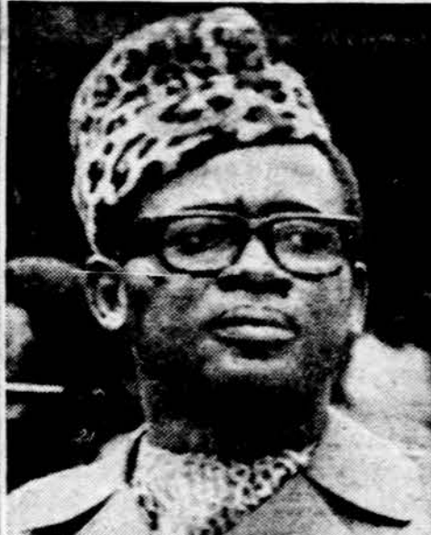
Mobutu Sese Seko

Kareivių ar kitokios pagalbos žada atsiųsti Egiptas ir Sudanas. Belgija ir Kinija jau pasiūte karinės medžiagos, Amerika tik medikamentų.