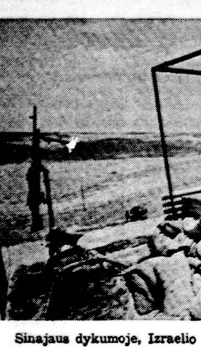
Sinajaus dykumoje, Izraelio ir Egipto valdomų teritorijų riba.