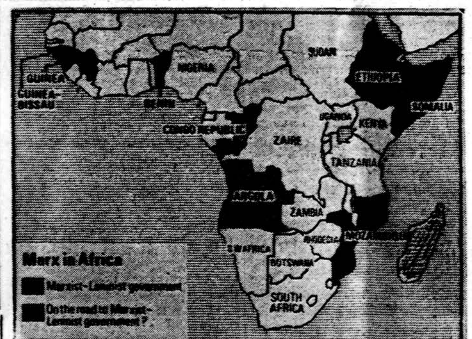
Juodai pažymėtos Afrikos valstybėse jau įsigalėję komunistai, o pilkai atžymėtos jau yra ženklų, kad komunistai gali paimti valdžią.

Antrasis politinis safari buvo Kubos prezidentas Fidel Castro anksčiau pradėjęs kelionę už Podgorną, bet ją baigęs tą patią dieną su pirmuoju ir IV. 4 jau atskridęs į Maskvą ilgesniems pasitarimams.