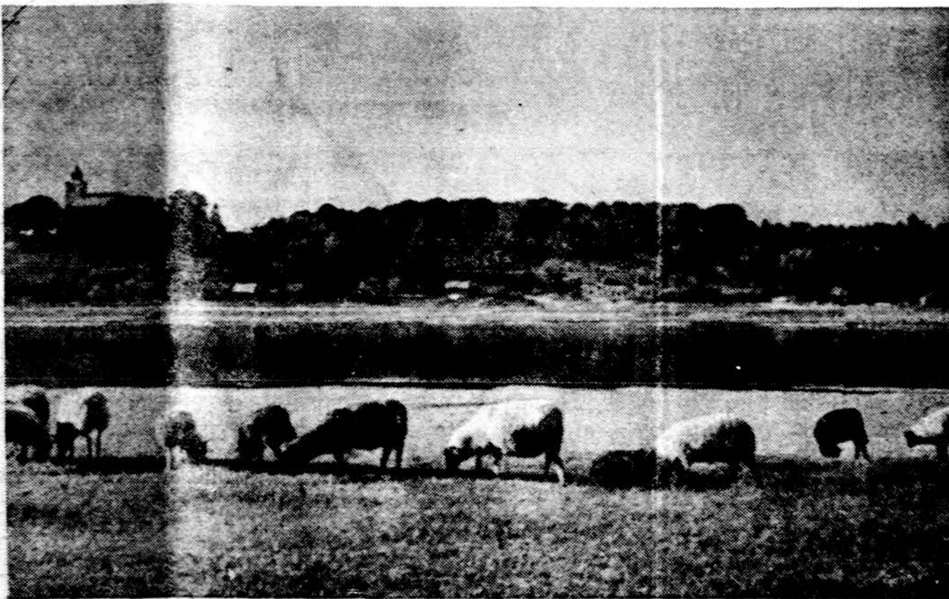
Nemunas ir Veliuona