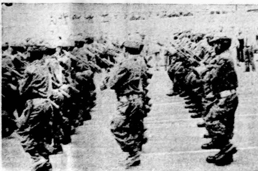
Ne visi pignejai kariauja tik nuodingomis strėlėmis. Nuotraukoj Zairo kariuomenės pignejų dalinys moderniai apginkluotas.

Apšakičiuojama, kad šiaurės Alaskoje natūralių dujų gali būti apie 20 trilijonų kubinių pėdų. Per 25 metus aprūpintų 5 proc. Amerikos klientų.