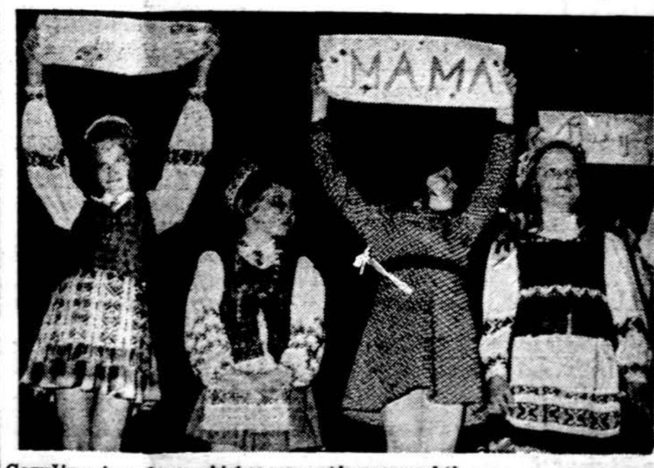
Gegužės mėnuo buvo skirtas mamytėms pagerbti.

— Saugumo gelimas priešinais kiekvienai didei ir kilniai iniciatyvai.