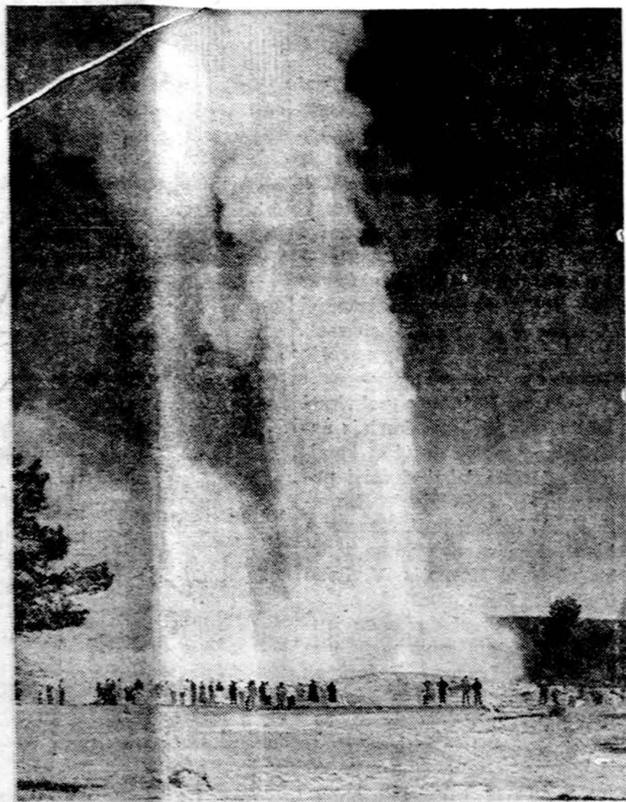
Yellowstone nacionalinis parkas, Old Faithful geizeris