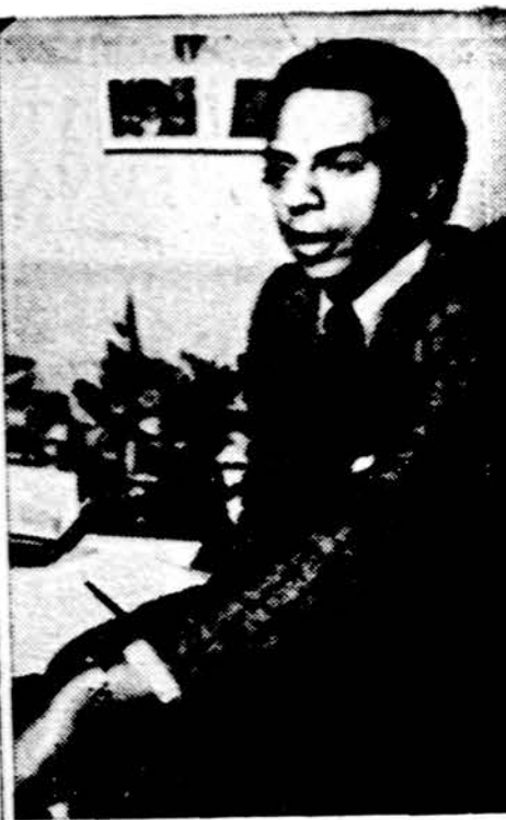
JAV-bių ambasadorius Jungtinėms Tautoms Young