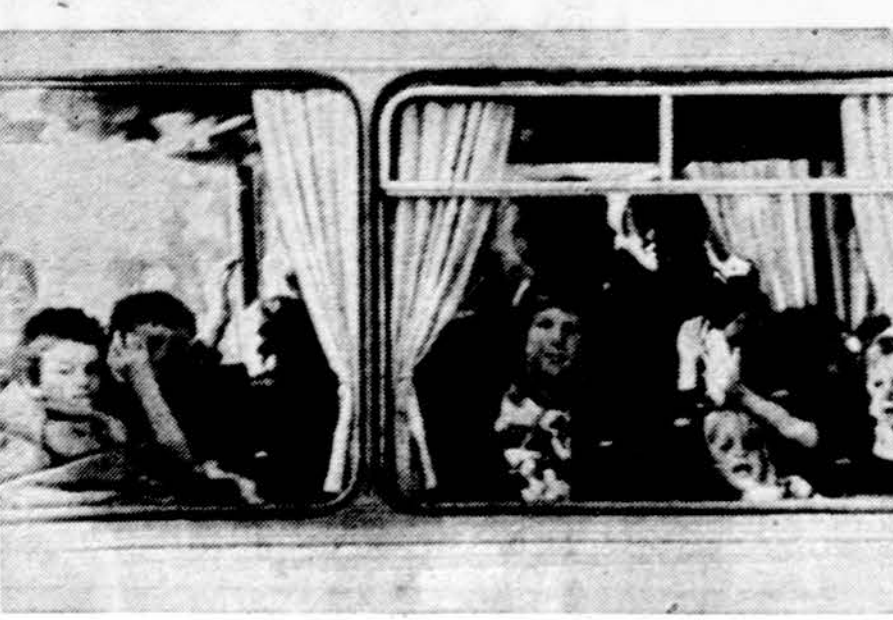
Assen, Olandija. 105 vaikai, teroristų molukų išlaikyti keturias dienas įkaitais mokykloje, laimingai grįžta namo

Assen. — Antradienį buvo laidojami šeši nušauti molukai teroristai — penki vyrai, viena moteris. I laidotuves suvažiojo apie 5,500 molukų. Nušautuosius jų tautiečiai vadina kankiniais. Vokiečių "Stern" žurnalas sako, kad molukai su įkaitais norėjo iškristi i Vietnamą. Olandijos vyriausybė būtų juos išleidusi, jei jie būtų išvykę vieni, nerikant politikos, karines ir mokslines" paslaptis.