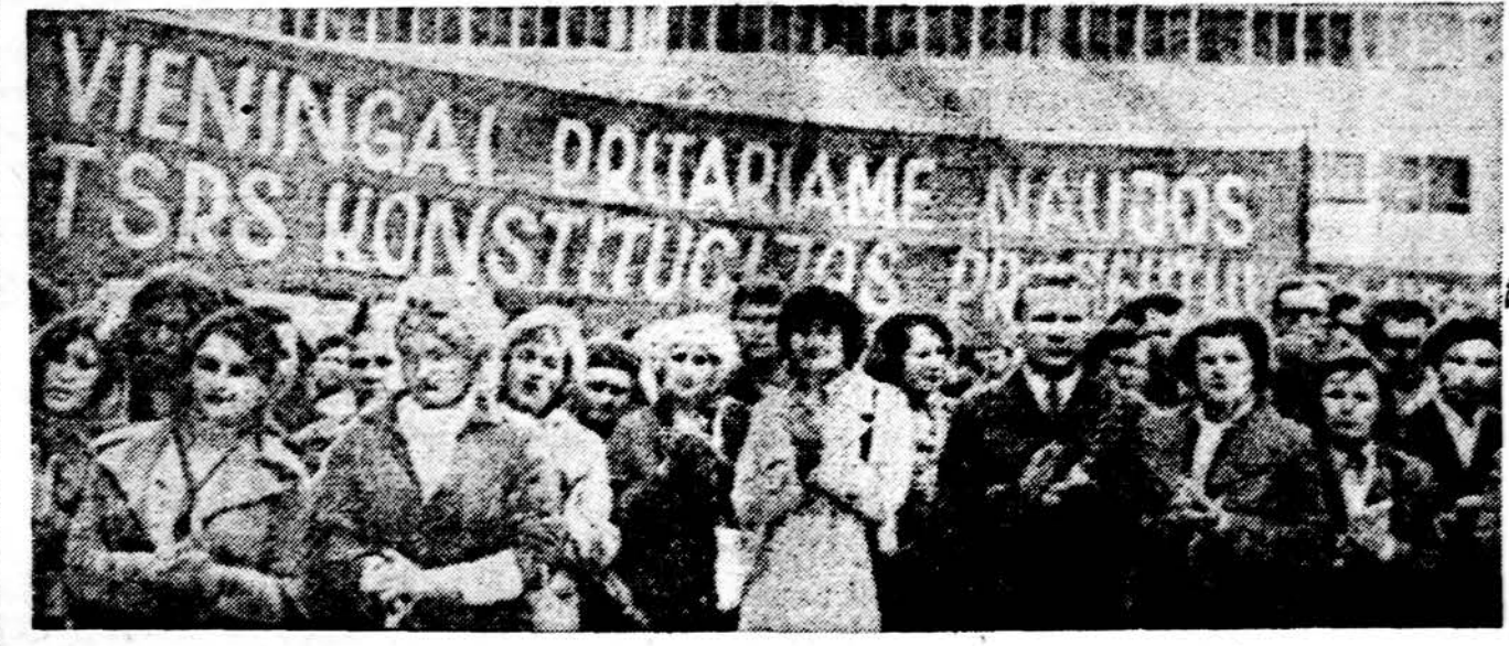
Visoj pavergtoj Lietuvoj žmonės varomi "vieningai" pritarti Sov. Rusijos konstitucijai. Čia matyti Elektrėnų gyvenvietės žmonės, suvaryti pasidžiaugti konstitucija, kuri apsaugo diktatorių.

Kitaip su sąjungininkais Metų pradžioje prez. Carteris lankė V. Europą. Kelionės tikslas buvo pakalbėti apie politinius reikalus ir sustiprinti ryšius. Tačiau svarbiausias uždavinys buvo įkalbėti Prancūziją ir V. Vokietiją, kad jos neparduotų laisvoms valstybėms ir nekomunistinėms diktatūroms atominių jėgainių įrengimų. Jis rėmė išvada, kad jos gali jas panaudoti atominiams ginklams gaminti. Jei tos valstybės negaus pirkti įrengimų iš Europos pramoninių valstybių, jos gali kreiptis į Sovietų Sąjungą. Gali atsistoti kaip su Egiptu. JAV atsakė ant Nilo statyti užtvanką, ją pastatė Sovietai. Tuo pačiu metu arabus pastūmėjo į Sovietų glėbį. Gali panašiai atsistoti ir su kitais kraštais, kurie stipriai priešinasi komunistų užmačioms.