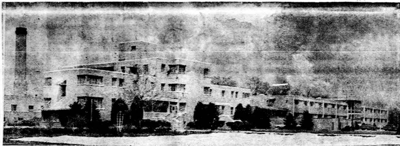
Sv. Seimos vilos vaizdas. Čia senatvės poilsiu naudojasi daugelis lietuvių ir kitų tautybių senelių, kurie gerai prižiūrimi Sv. Kazimiero seserų vienuolių

× Atostogų sezonas Gintaro vasarvietėje Union Pier, Michigan ežero kopose jau prasidėjo. Atvykite, pamirškite kasdienes rūpesčius ir pasidžiaukite visais vasaros malonumais. Pajvairinimui jūsų atostogų čia yra lauko teniso aikštė, stalo tenisas, biliardas ir kiti žaidimai. Dėl rezervacijų prašome skambinti (616) 469-3298 arba rašyti: Gintaras, 15860 Lake Shore Rd., Union Pier, Michigan 49129. (sk.)