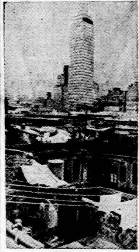
Meksikos kontrastai: dangorėžiai ir lūšnynai

Naujasis prezidentas Jose Lopez Portillo griebsi tam tikrų būtinų ekonominių reformų. Pigininis vienetas, pesa, nuvertinta. Tai leido sumažinti importą, pakelti eksportą, bet sumažino pasitikėjimą piniginiu vienetu. Portillo visokiomis priemonėmis nori infliaciją sumažinti 12 proc. per metus. Nesiseka tik ir jam pašalinti korupcijas. Ji labai giliai įleidusi šaknis. Dėl korupcijos nesiseka nei praveisti būtinai