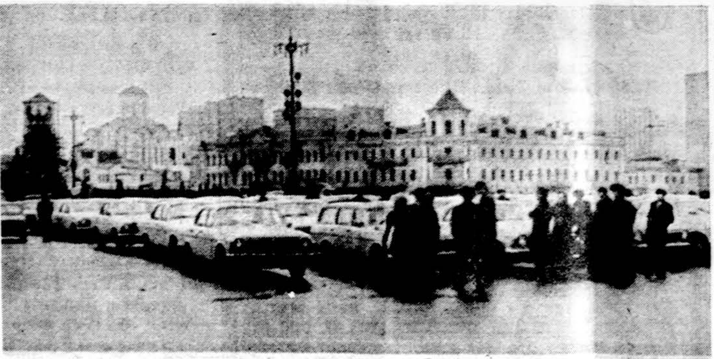
Sovietų Sąjungoje taksų automobilių tarifai buvo pakelti dvigubai. Pervazuoti per visą Maskvą kainuoja 8 rublius. Šiuo atveju susidarė eilės prie automobilių, bet laukiančių automobilių eilės

Detroitas. — Sustreikavo Detroito miesto darbininkai, sustoję ir autobusų judėjimas.