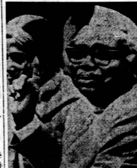
Jagjivan Ram, naujasis Indijos gynybos ministeris

O paskutinėje SNO Generalinės asamblėjos sesijoje Pekinas balsavo prieš rezoliuciją, reikalaujančią sudaryti sutartį dėl visiško ir visuotinio branduolinio ginklo bandymų uždraudimo".