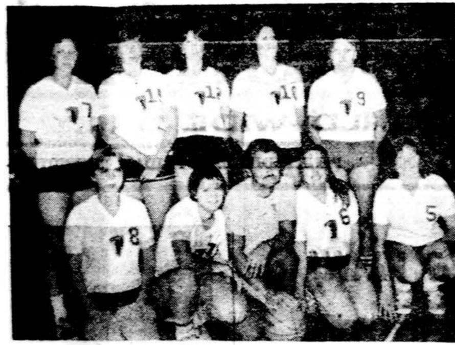
Australijos lietuvių moterų krepšinio rinktinė

Garsiausias pasaulio futboli- ninkas Pelė atmetė New Yorko Cosmos naują pasiūlymą pratęsti kontraktą dar dvejiems metams už 10 mil. dolerių. Spalio 1 d. jis žais paskutinę profesionali- nės rungtynes ir po to grįš į Bra- ziliją.