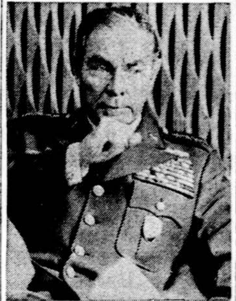
Gen. Al. M. Haig, vyriausias NATO dalinių Europoje vadas

Turime Pedagoginį liuanistikos institutą, kuris kasmet išleidžia po mažą būrelį mokytojų baigusių. Turime ir prie liuanistinių mokyklų pedagoginius dviejų metų kursus, pvz. Detroito, Clevelando. Tiek Pedagoginį li-