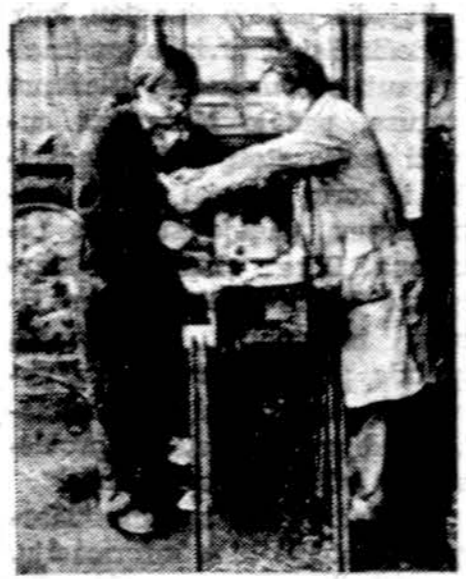
Vakarų Vokietijos jaunuolis vasaros atostogų metu įmonėje paruošiamas fabriko darbai