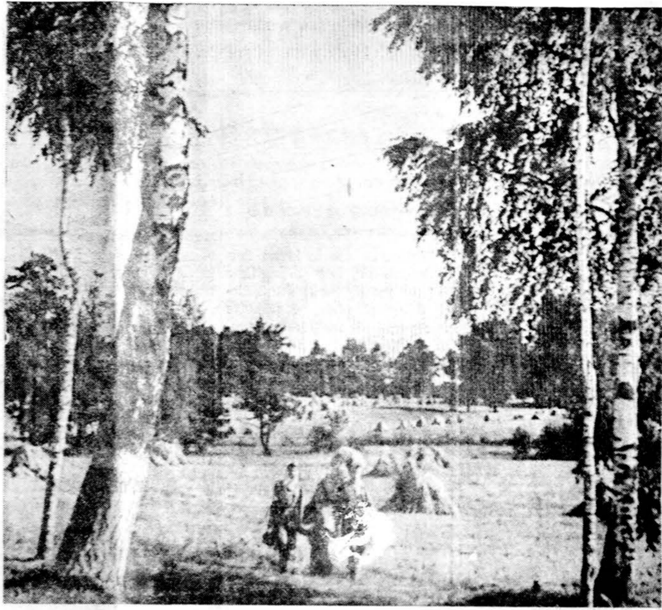
Gubos ir beržai Lietuvos laukuose

Susumuodamas padėti sovietų disidentams pareiškė: "Helsinkio susitarimai dėl žmogaus teisių buvo gera mintis, ir Vakarai, ypač prez. Carteris, darė nuostabių pastangų. Visi turime būti dėkingi ir viltis, kad tos pastangos nenutruks. Tačiau, nuo dabar, bent Belgrado konferencijoje, daugiausia bus bergždžios kalbos. Abejojau, ar visa Belgrado konferencija sutrumpins bet kurio politinio kalinio kančias nors vieną dieną".