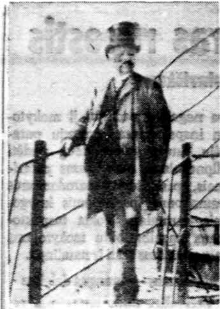
Garsusis Eifelio bokštas Paryžiuje paseno ir reikalingas skubaus remonto. Bokšto aukštis 320 metrų, svoris 7000 tonų. Bokštas sumontuotas iš 2,5 milijono įvairių dalių bei daiktelių. Bokšto amžius — 88 metai. Čia matome jo statytoją inžinierių Eiffelį.

Pas buv. Lietuvos ir Kanados šachmatų meistrę Povilą Vaitonį apsilankė nepriklausomos