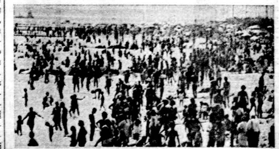
Kai New Yorke buvo šimtas laipsnių, Coney Island plažas buvo perkrautas

Statomas dar vienas toks erdvėlaivis. Visa programa iki 1979 metų kainuos 5.2 bil. dolerių.