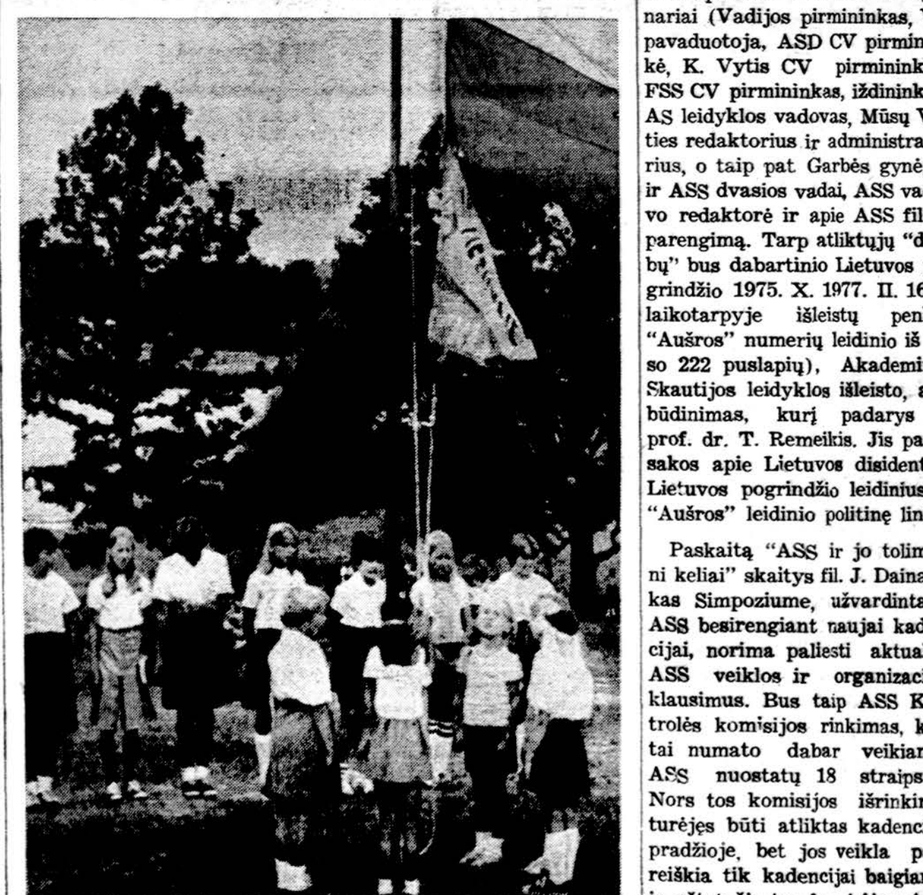
Šis lietuvių stovyklos užbaigimo iškilimų Dainavoje. Vėliavos nuleidimas.

Vieta, kur kitados buvo torpedų fabrikas Forest Parke, pri-klaušo paštui. Dabar paštas tą sąlysu laisves, nutarė ginti ir nacių, pasilaisvę maršuoti Skokie priemies-