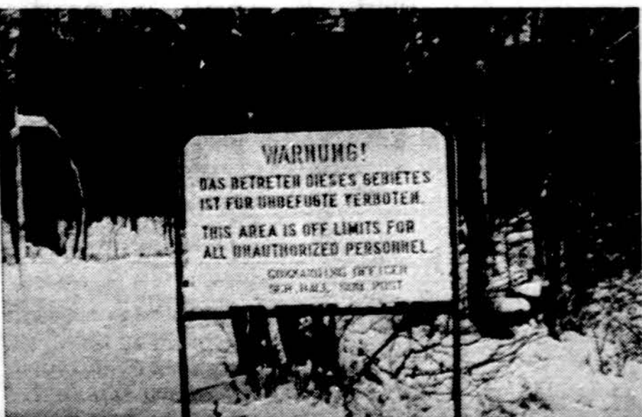
Amerikiečių amunicijos sandėliai kažkur Vakarų Vokietijos žemėje

Rovigo, Italija. — Per vieną savaitę banditai apiplėšė keturis italų traukinius. Paskutinis apiplėšimas buvo pašto vagono, išnešė vertybių už 54,500 dol.