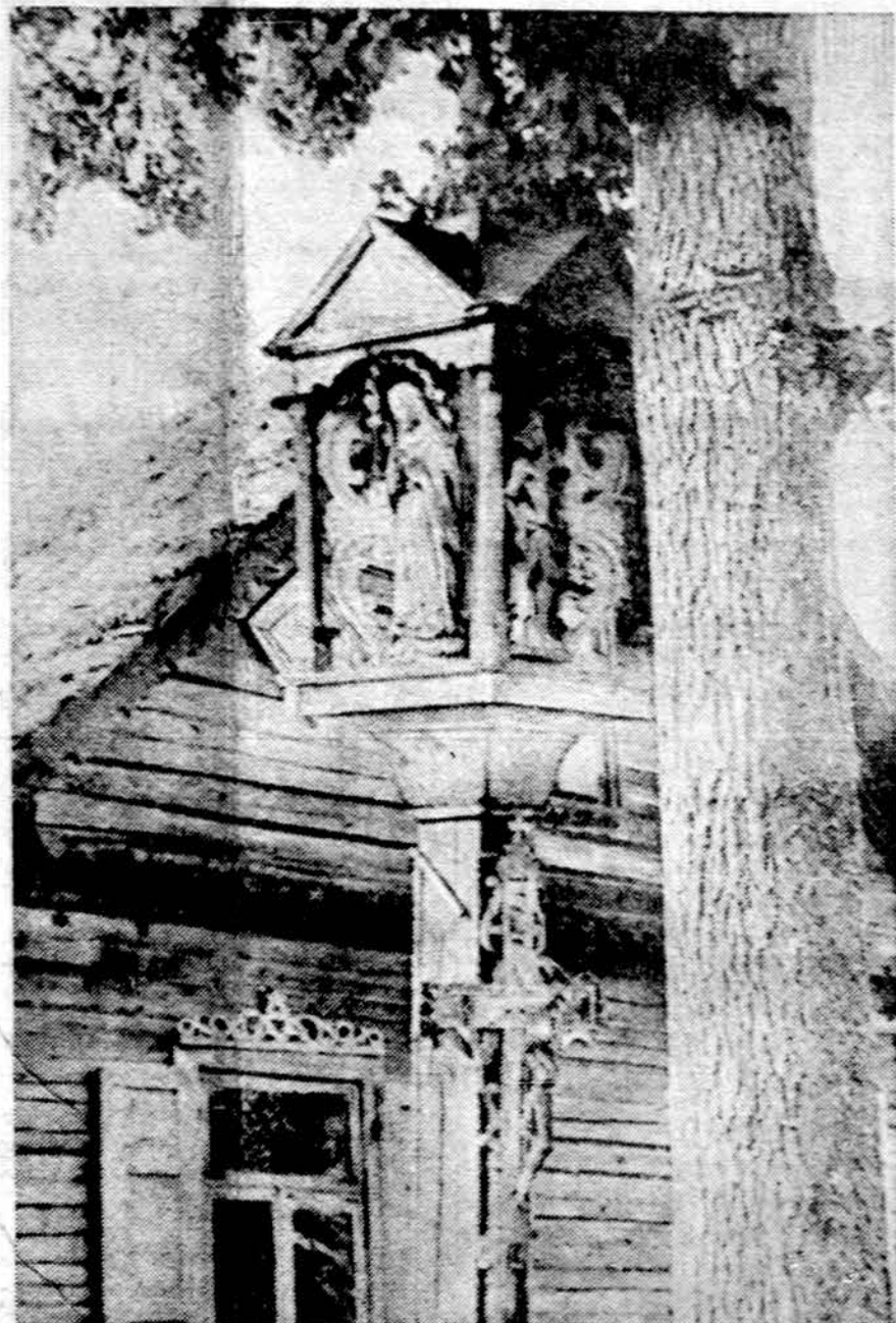
Koplytėlė su Marijos statulėle. Nežinomo lietuvių liaudies menininko kūrinys Sėdeikonių km., Joniškėlio vls., Biržų aps.

Gerbiamas šių eilučių skaitytojau, jei būsi kuomet Pelesoj, vidury plačių kaimo laukų išvysi mūsų amžiaus gėdą — stovi išniekinta bažnyčia — likęs be bokštų keturkampis pastatas, apstatytas bauriomis pašūreimis. Tai vietinio kolchozo sandėlis. Šiurpu ir nejauku žiūrėti į tą pastatą. Ir norisi šaukti: Nuo maro, bado, ugnies ir karo... ir nuo genocido gelbėk mus, Viešpatie! (E).