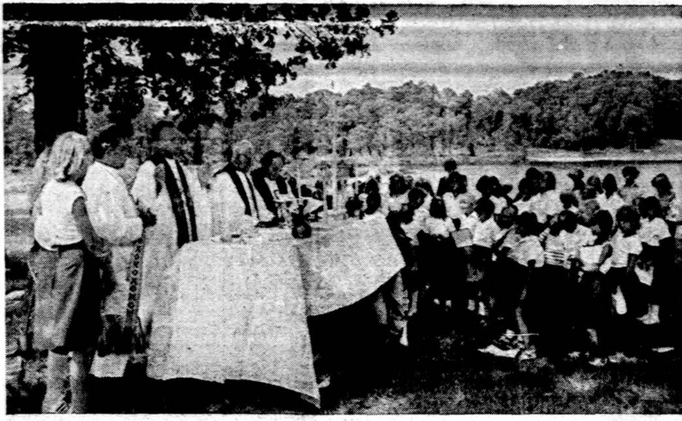
Šis Dainavos stovyklos metinės šventės. Pamaldos

Po susirinkimo pasivažiinta kavute ir sesių paruoštais sumuštiniais. J. Y.