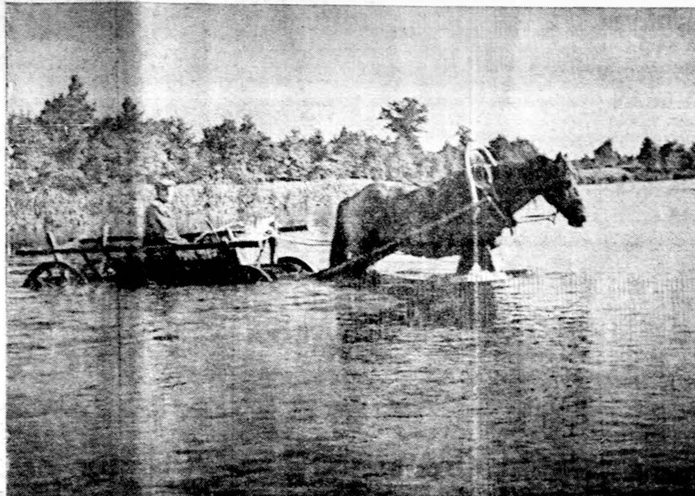
Nemunas aukštupy, gūdų žemėje, kur tiltų dar nereikia

Budapestas. — Billy Graham, žinomas evangelistas, rugsėjo 3 pradės savo pamokslus Vengrijoje. Tai bus pirmas atvejis, kai jam leidžiama tai daryti sovietų bloke.