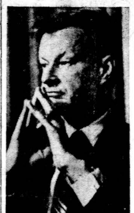
Zbigniew Brzezinski, prezidento Carterio artimas patarėjas

Jis daro kelias ryškias klaidas. Ryškiausia jo klaida, kad nuo mokesčių apdėjimo priklauso piliečių politinė laisvė. Būdamas ekonomistas turi žinoti, kad ūkis yra tik priemonė, nors ir labai svarbi priemonė. Beveik per 50 metų jo teigimu JAV mokesčiai pa-