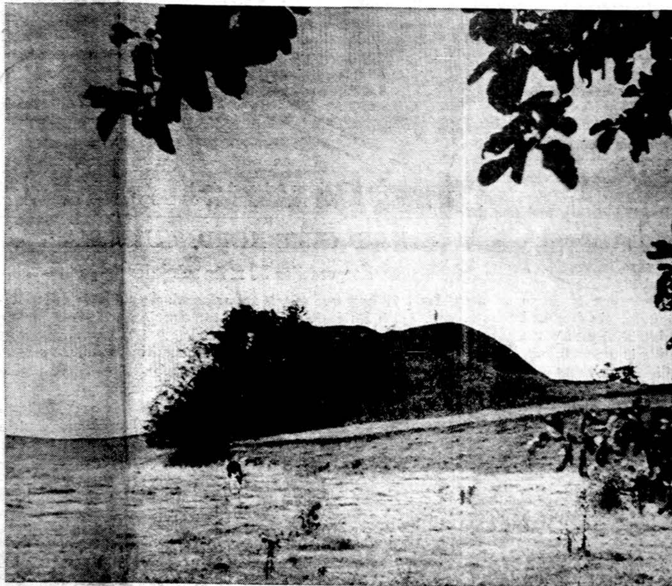
Rumbonių piliakalnis Alytaus apskrity