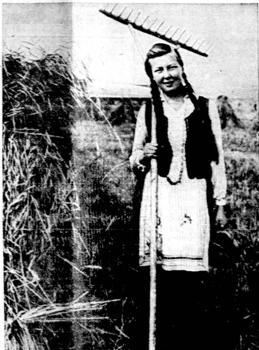
Grėbėjęlė grįžta iš darbo

Hitlerio pavaduotojas Hesses kalinamas jau 36 metai, o Stalino sėbras — M. Suslovas laisvai važinėja po pasaulį ir su pagarbą visų priimamas. Išėję į pensiją Vakarų diplomatai per miegus dažnai trina į pagalves savo rankas, kuriomis kadaise spaudė Hitlerio, Ribbentropo, Geringo ir kitų hitlerininkų dešines. Sveikindamiesi su M. Suslovu, šių dienų Vakarų diplomatai neranda reikalo po procedūros nusiplauti rankų. Težino jie, kad padorų žmogų vaidinančio M. Suslovo rankos daug kruvinesnės už Hesso, kad nuo jų dar nespėjo nudžiūti lietuvių ir kitų tautų kraujas.