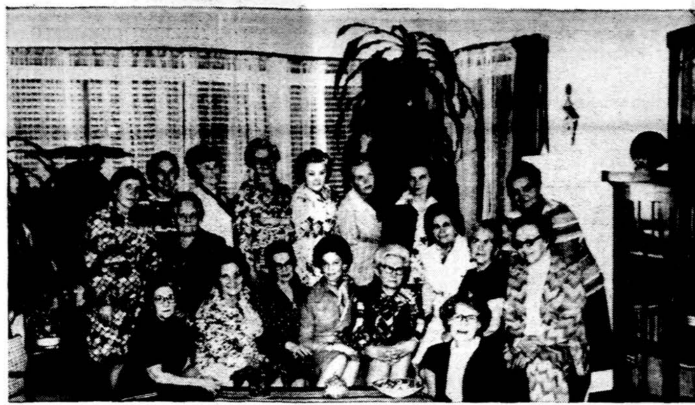
Putnamo seselių rėmėjos pasirošusios sutikti svečius madų parodoje