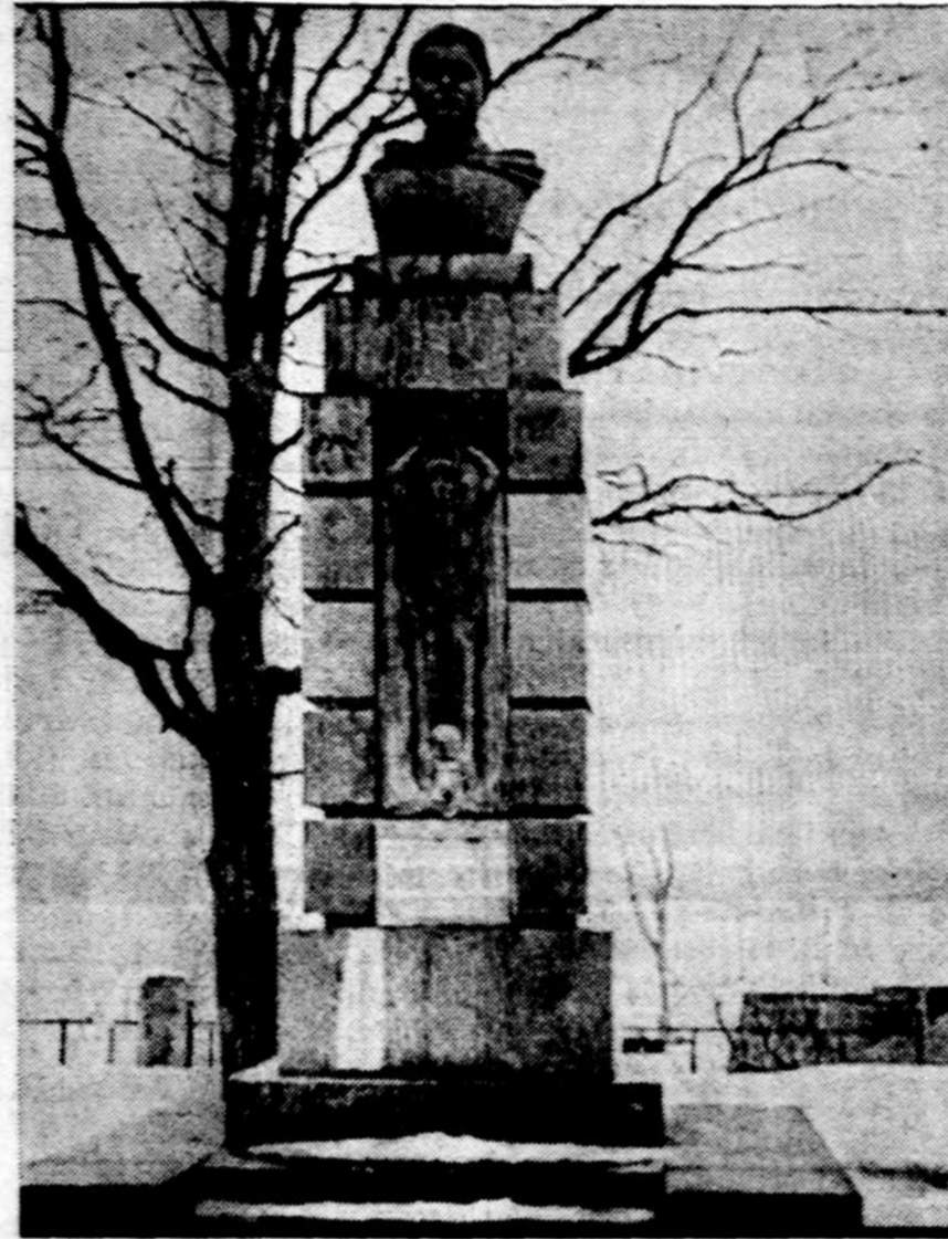
Tumo Vaizganto paminklas Svėdasuose

Laisvė Tėvynėn grįžti tremtiniui Solženicinui! Laisvė Sergėjui Kavalioviui! Laisvė kaliniams Lietuvos patriotams!