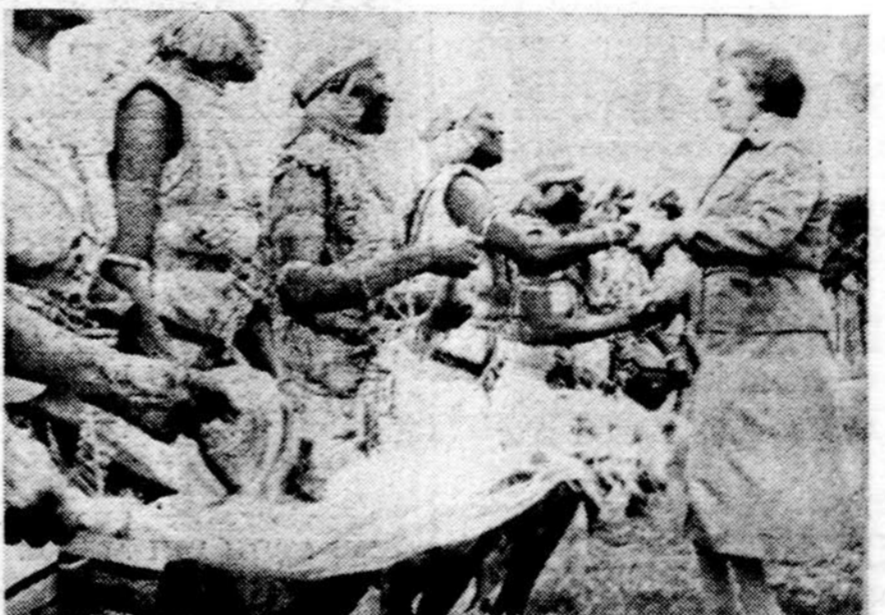
Vakarų Vokietijos ministerė atsilikusiems kraštams padėti Schlei buvo nuvykusi į Afriką, išsiaiškinti, kuom Vakarų Vokietija gali būti naujai susikūrusioms valstybėms reikalinga. Čia matome ją Kenijoje, kur ją maloniai sveikina vietos moterys, apsirergusios savo tautiniais drabužiais

— Pasaulyje beraščių ligi 1980 m. padaugės 20 ml. Bus jų apie 820 ml. Jų tarpe beraščių vaikų, 5—14 m., bus 240 ml.