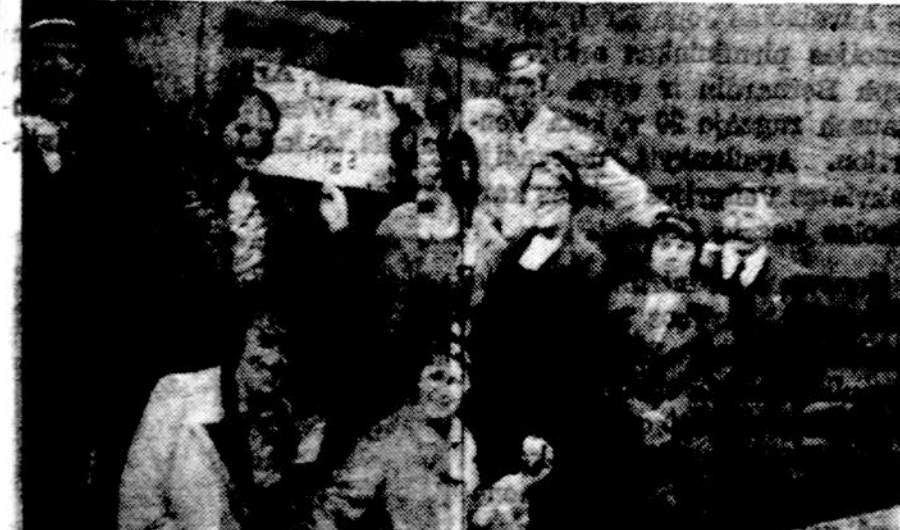
Kaunas — Ryga, arba linksma Satrijos ir Birutės korporantų-čių atstovų išvyka pas latvius studentus

"Ateities" žurnalo jaunimo konkurso terminas, rugsėjo 15 d. jau artėja. Konkurso sritys — proza, poezija, straipsniai — rašiniai, veiklos aprašymai, meno ir veiklos fotografija, piešiniai. (smulkesnė informacija ankstyvesniuose "Ateities" pranešimuose). Konkurso premijos bus įteiktos "Ateities" vakare spalio 29 d., Chicagoje.