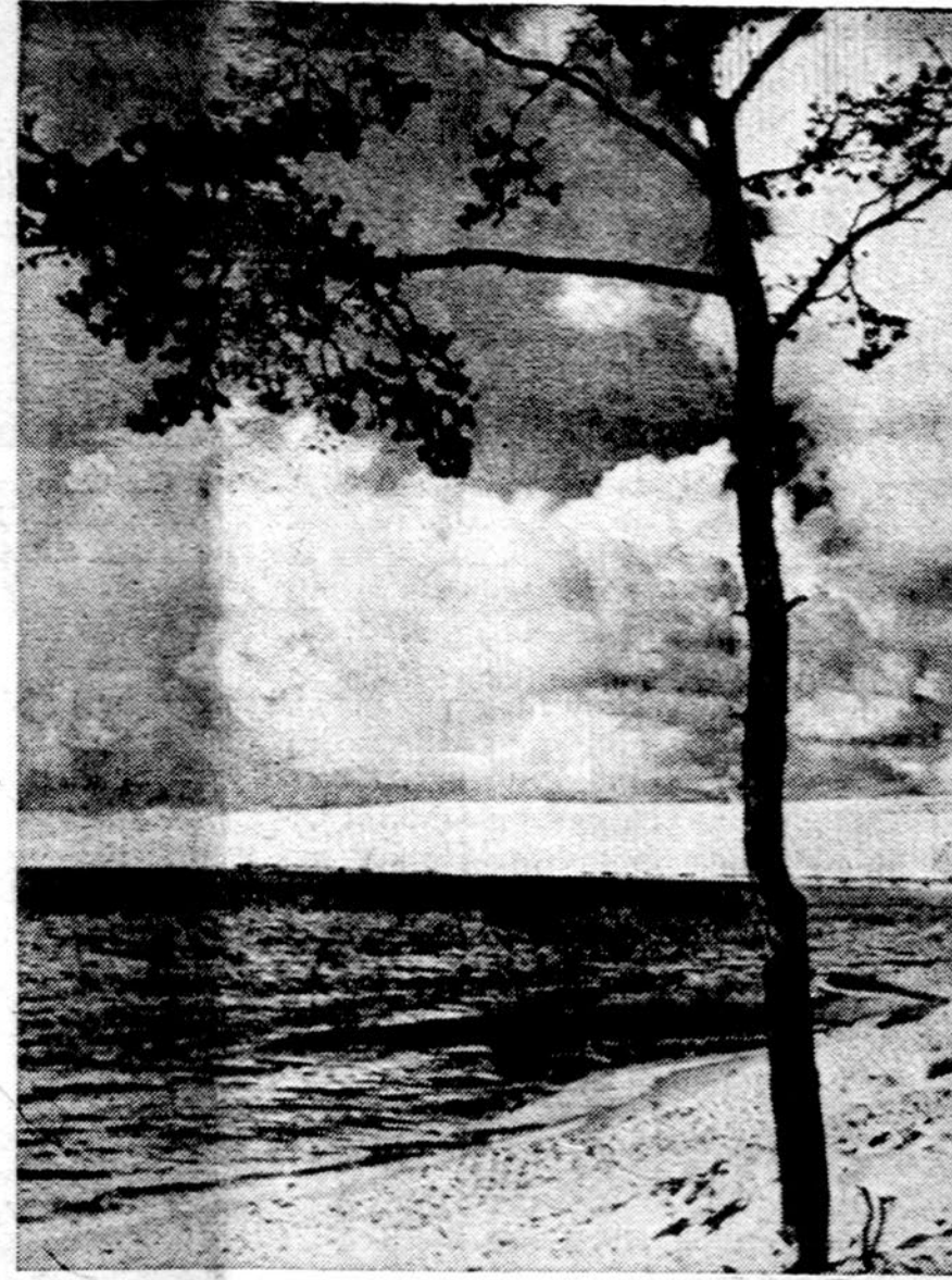
Vieniša pušis prie Kuršių marių netoli Nidos

Lietuvos Revoliucinis Išsivadavimo Frontas