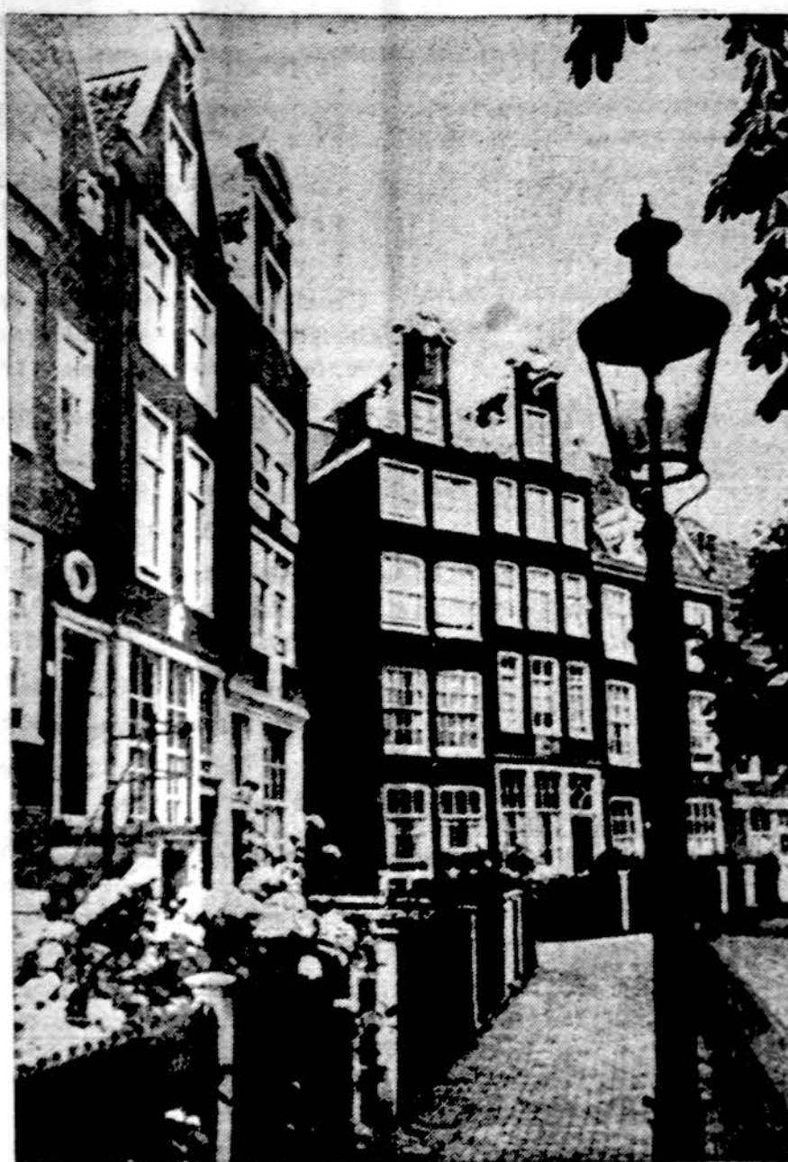
Amsterdamo, Olandijoje, kampelis