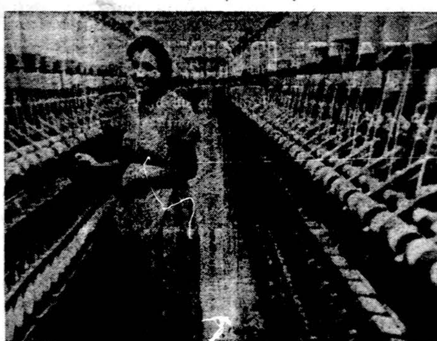
Ūkiniai atsilikusiai kraštai smarkiai modernėja. Tekstilės gamyba Alžyre, Afrikoje

Ūkinėje srityje, kurią jie remia savo viltis Iraką padaryti pavyzdžiu visam arabų pasauliui, jie atsisako socialistinių pradų praktiško prekybos pritaikymo naudai. Nepatenkinti komunistinių šalių gaminiais, jie Vakaruose įsigyja geriausių dirbinių ir prekų, kokių tik gali gauti. Prekyba su JAV tolydžio plečiasi. Nuo 1972 m. 23 mil. dol., 1976 m. pakilo iki 400 mil. dol. Vakarų Vo-