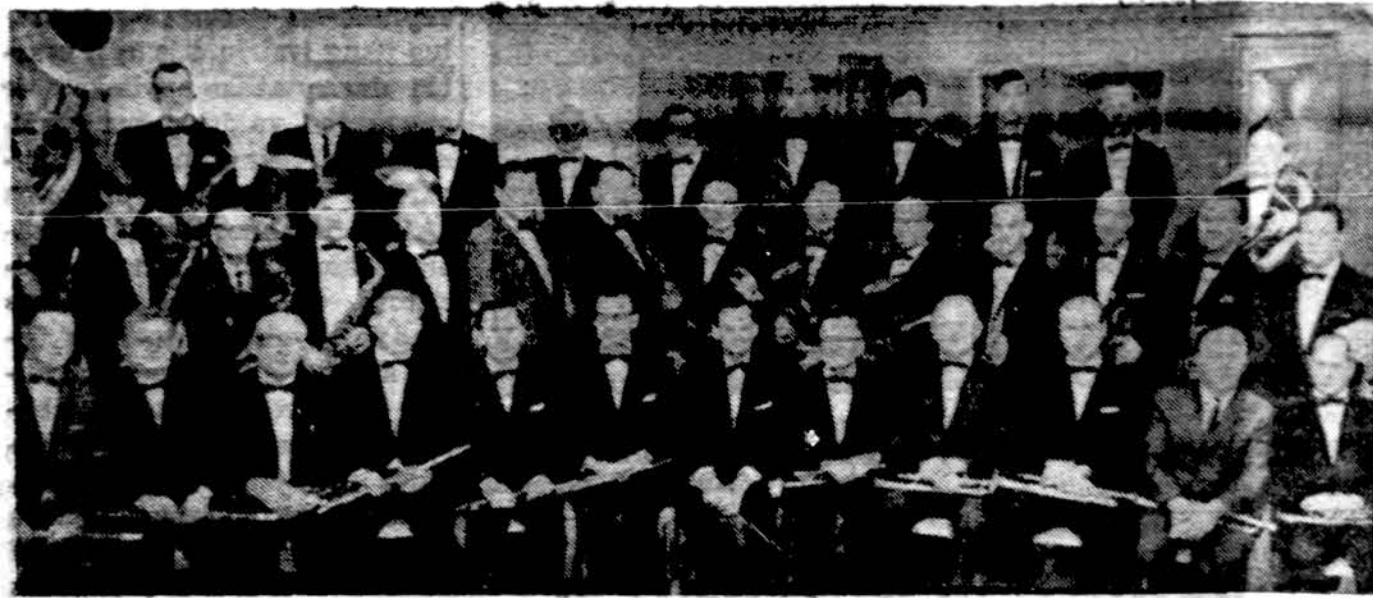
Orkestras "Estonia", kuris atliko lietuviškos muzikos koncertą kariuomenės šventės minėjime Toronto Lietuvių namuose, lapkričio 19 d.