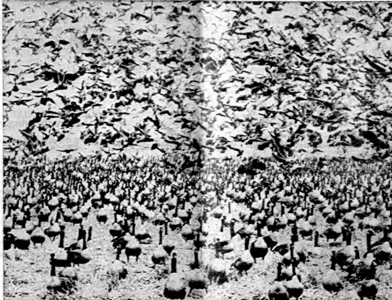
Rudens melodija. Tūkstančiai laukinių žasų, pakelėj į šiltus kraštus, išsisi Horicon draustiny, Wisconsin