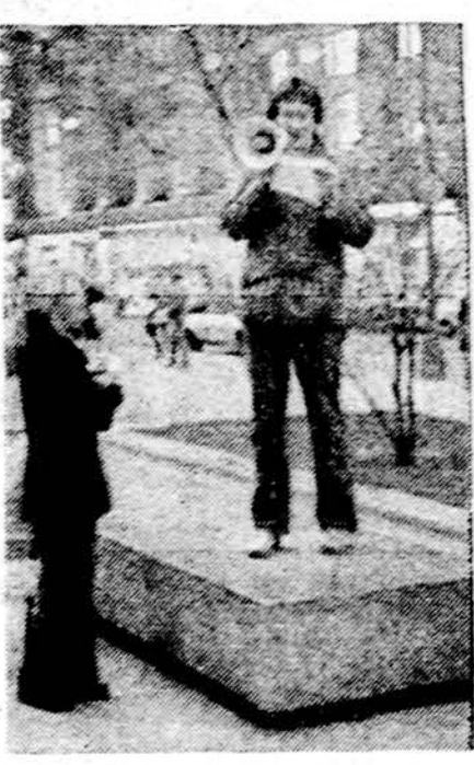
Iš demonstracijų Chicagoje.