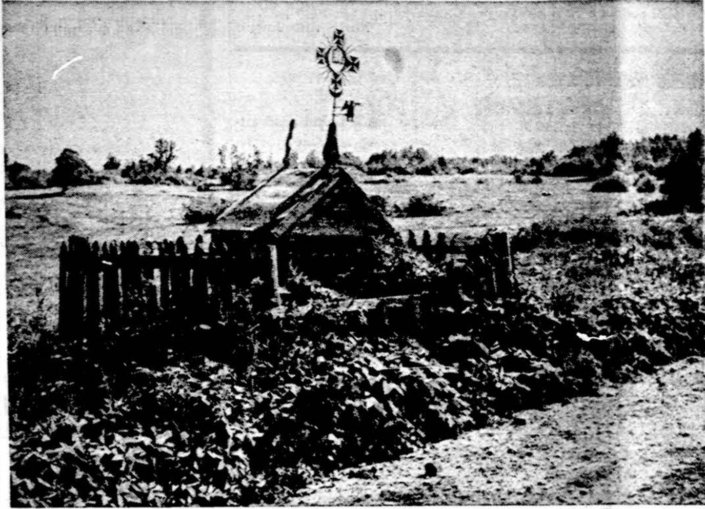
Sena koplytėlė Zemaitijos laukuose

Varšuva. — Varšuvoje šiuo metu statomas šešios naujos katalikų bažnyčios. Valdžia yra davusi leidimą pastatyti dar dvi naujas bažnyčias ir restauruoti kitą, sugriautą Antrojo pasaulinio karo metu ir iki šiol neatstatytą. Taip pat gautas valdžios leidimas dešimčiai naujų bažnyčių už Varšuvos miesto ribų, arkivyskupijos teritorijoje.