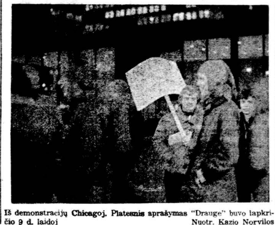
Iš demonstracijų Chicagoj. Platemis aprašymas "Drauge" buvo lapkričio 9 d. laidoj