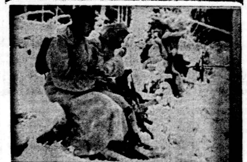
Lietuvių partizanai Romintos girioje (1947.XII.21)