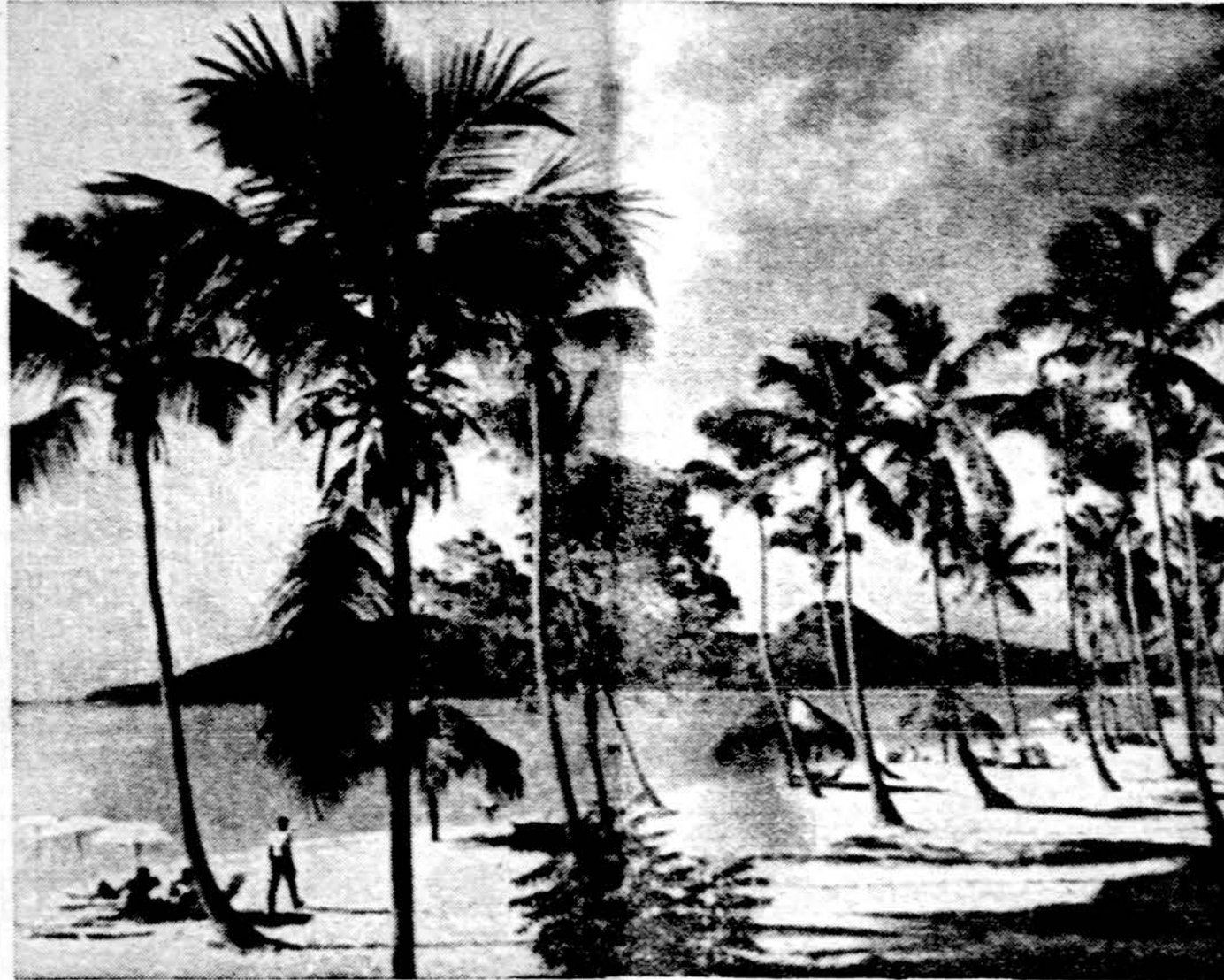
Jolly Beach, Antigua, Karibų jūroje

Kitimi žiniomis, Lenkijoje moterys dirbančios tekstilėje, pareikalavo arba daugiau atvežti į krautuves mėsos, kad nereikėtų po darbo stovėti ir nervintis eilutėms, arba būtų išduotos kortelės, tada žinotų, kiekvienu, kiek jai priklauso gauti.