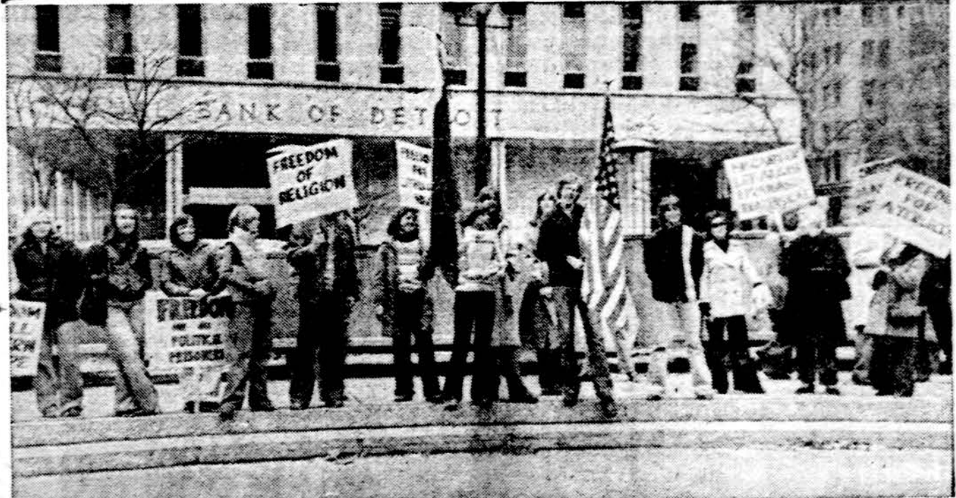
Detroito lietuvių jaunimas demonstruoja lapkričio 5 d. už žmogaus teises ir Pabaltijo tautų laisvę.

Sovietų kontroliuojamos, kurios yra Jungtinėse Amerikos Valstybėse yra ATORG New York City — ji atliekanti prekybos bendro pobūdžio transakcijas; BELORUS Machinery of USA, inc. — Milwaukee, Wisc., importuoja Sovietų gamybos traktorius; Morfort American Shipping, inc. — Clark, N. J., yra bene didžiausia sovietų kontroliuojama perisusio agentūra JAV; The US — USSR Marine Resources Co., inc. — Seattle, Wash., aptarnauja Sovietų žvejojimo laivyną JAV pacifiko pakraščiuje; Sovfracht (USA) inc. — New York City — Sovietų prekybos laivyno agentūra, kuri prižiūri benzino, alyvos ir kitų prekių siuntą jų laivais.