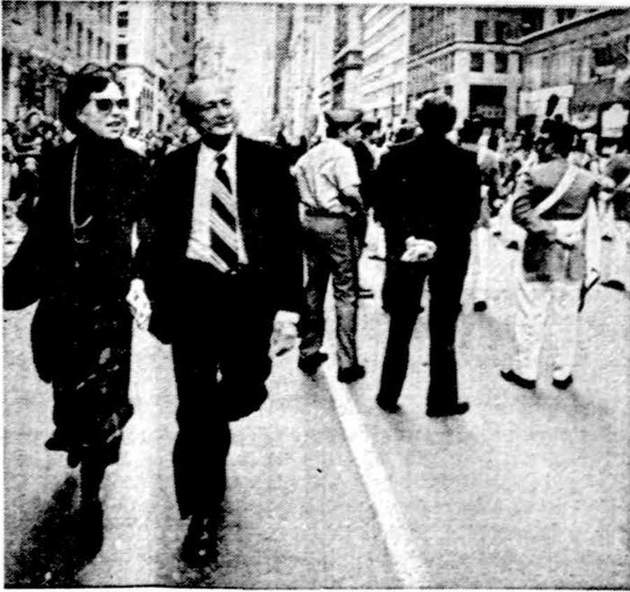
Naujas New Yorko maras Koch 5-oj Ave. vieno parado metu