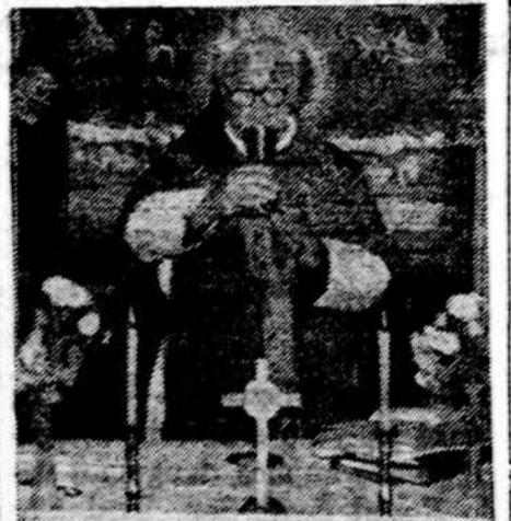
Meldžiamės už mirusius Lietuvos sodyboje, Chicagoje

Dėl Tamstos padarytos klaidos (laiku nesiooperavimo) dabar nėra ko dejuoti, o reikia tvarkytis kas dabar reikia ir galima. O daug kas galima Tamstai šiandien padėti. Tik, ar Pats išpildysi -