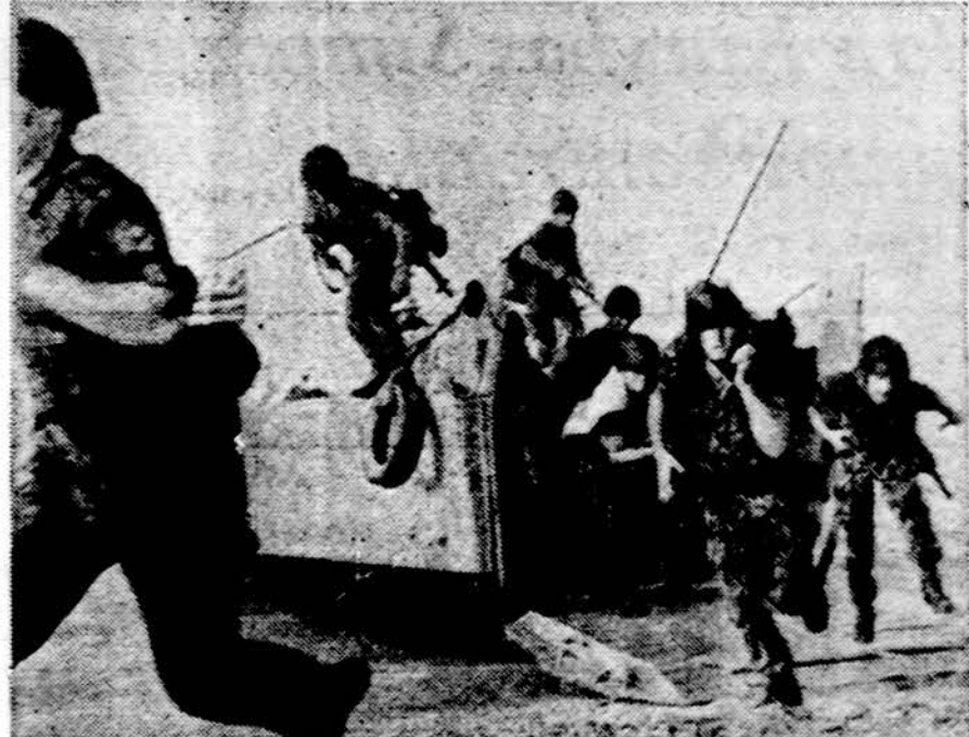
Graikijos kartų dalinys manevrų metu iš laivo keliasi į sausumą. Graikija vėl pasuko NATO link

Visoki atveju, kaip mes iš savo tautinio taško į JT bežiūrėtume, nesitikėtume, kad ji nors kiek palengvintų mūsų pavergtos tautos skausmus.