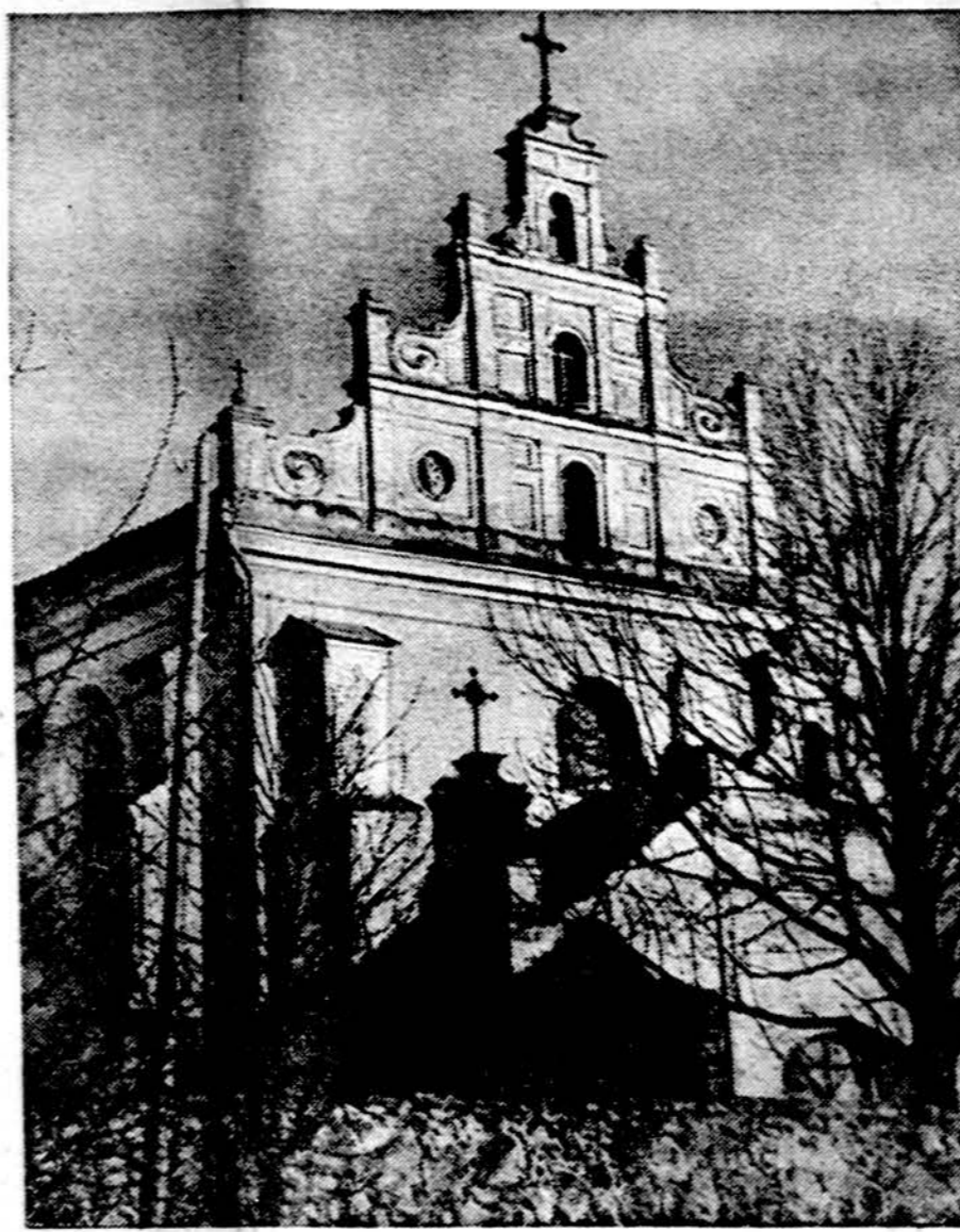
Merkinės bažnyčia, statyta 15 amžiuje