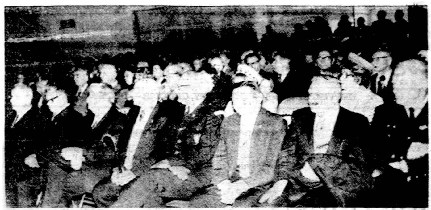
Iš kariuomenės šventės minėjimo Detroito. Priekyje garbės svečiai - savanoriai ir Klaipėdos krašto vaduotojai.