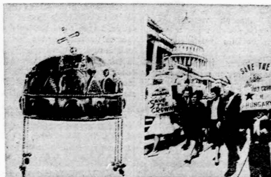
Amerikiečiai vengrai demonstruoja Washingtone, protestuodami prieš nutarimą šv. Stepono vainiką grąžinti komunistinei Vengrijai